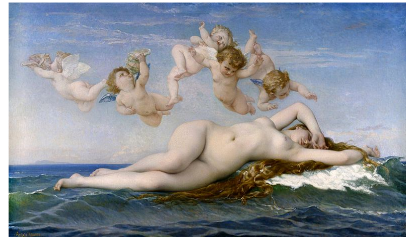
Alexandre CABANEL La naissance de Venus, 1863