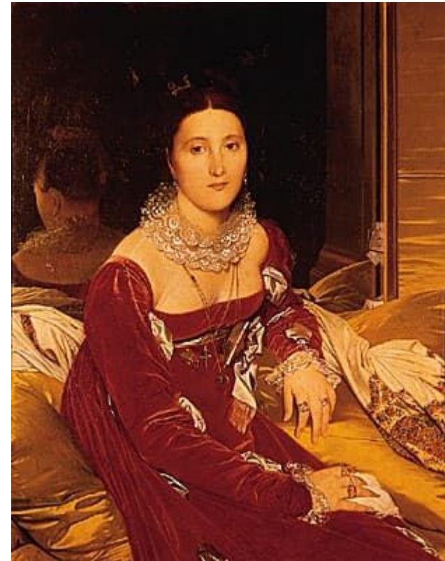
Ingres, Madame de Senonnes