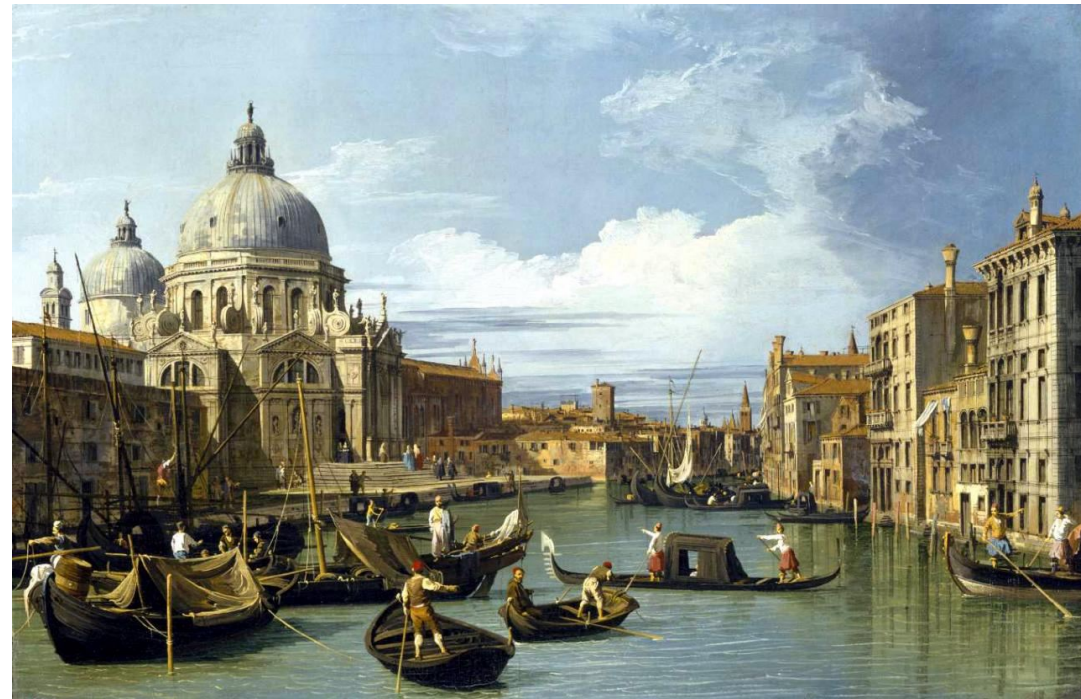
Canaletto. Le Grand Canal et l'Eglise de la Salute , 1730