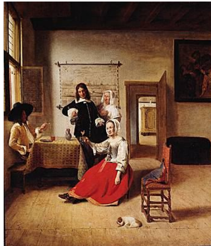
Pieter De Hooch, la Buveuse