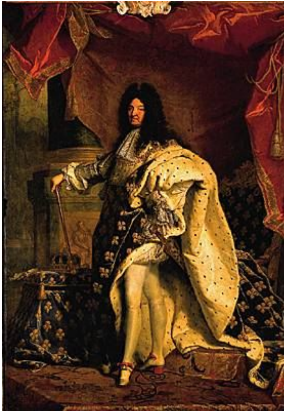
Louis XIV par Rigaud