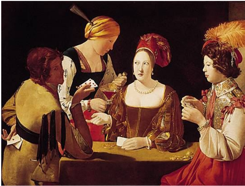
Georges de La Tour, le Tricheur à l'as de carreau