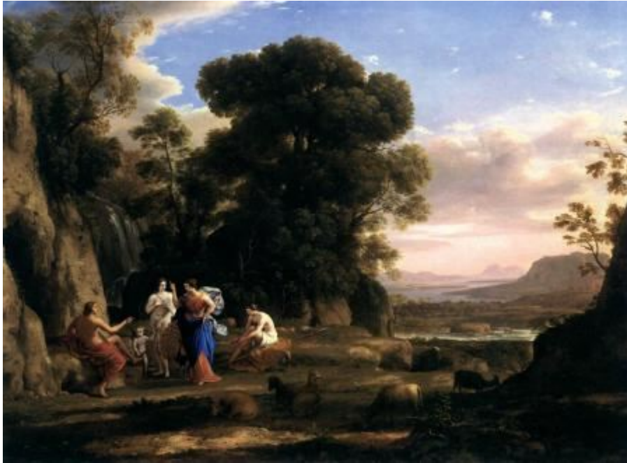
Claude Lorrain. Le jugement de Pâris (1645-46)