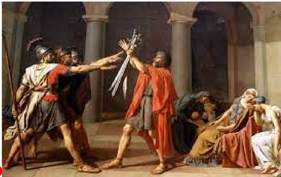
DAVID Le serment des Horaces, 1784