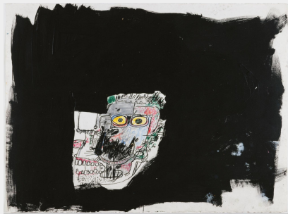
Jean-Michel Basquiat (1960, États-Unis - 1988, États-Unis) Sans titre 1983