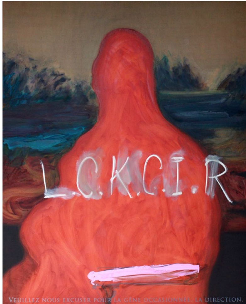
Mona L.C.K.C.I.R (Léonard de Vinci) - 2010 - Huile sur toile - 200x160 cm