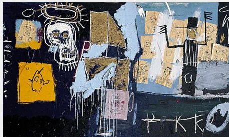
Jean-Michel Basquiat (1960, États-Unis - 1988, États-Unis) Slave Auction (Vente aux enchères d'esclaves) 1982