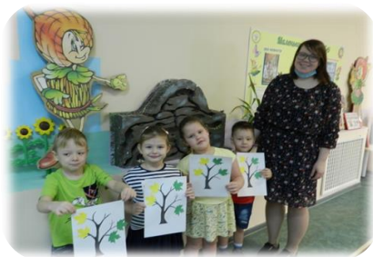
Из опыта работа детского сада «Сказка»:

ЦЕЛЬ МЕТОДА — ДЕТАЛЬНАЯ РАЗРАБОТКА ПРОБЛЕМЫ, КОТОРАЯ ДОЛЖНА ЗАВЕРШИТЬСЯ ВПОЛНЕ РЕАЛЬНЫМИ, ОСЯЗАЕМЫМИ ПРАКТИЧЕСКИМИ РЕЗУЛЬТАТАМИ