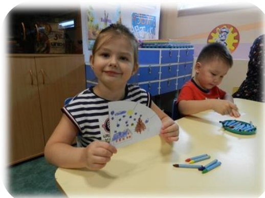
Проект «Моделирование образовательной среды для развития у детей старшего дошкольного возраста навыков ответственное экологического поведения»