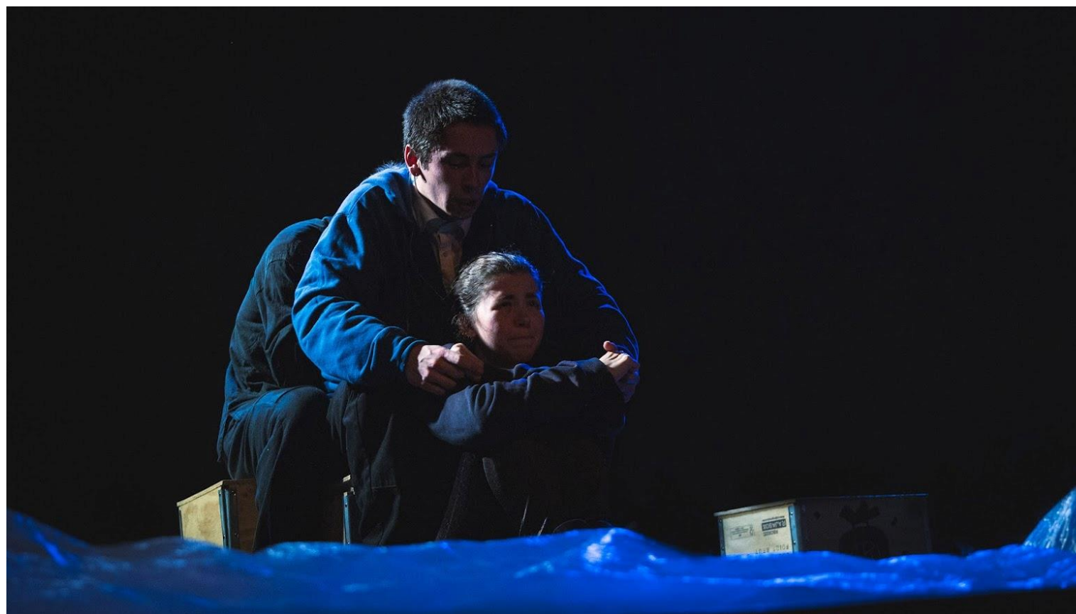
Les Somnambules du Monde qui va , épisode 1, Théâtre Douze, décembre 2023.

Une catastrophe climatique provoque l'inondation du monde. En France, il ne reste plus que les montagnes. Tout est autre. Les autorités ordonnent de « ne rien prendre qui vienne de la mer ». Or, sur la mer, il y a un bateau, le Démétrius, qui a recueilli des adolescents naufragés. Alors qu'il erre sur la Grande-Mer sans jamais obtenir l'autorisation d'accoster, le bateau finit par atteindre le « continent de plastique » où les passagers décident de bâtir une utopie.