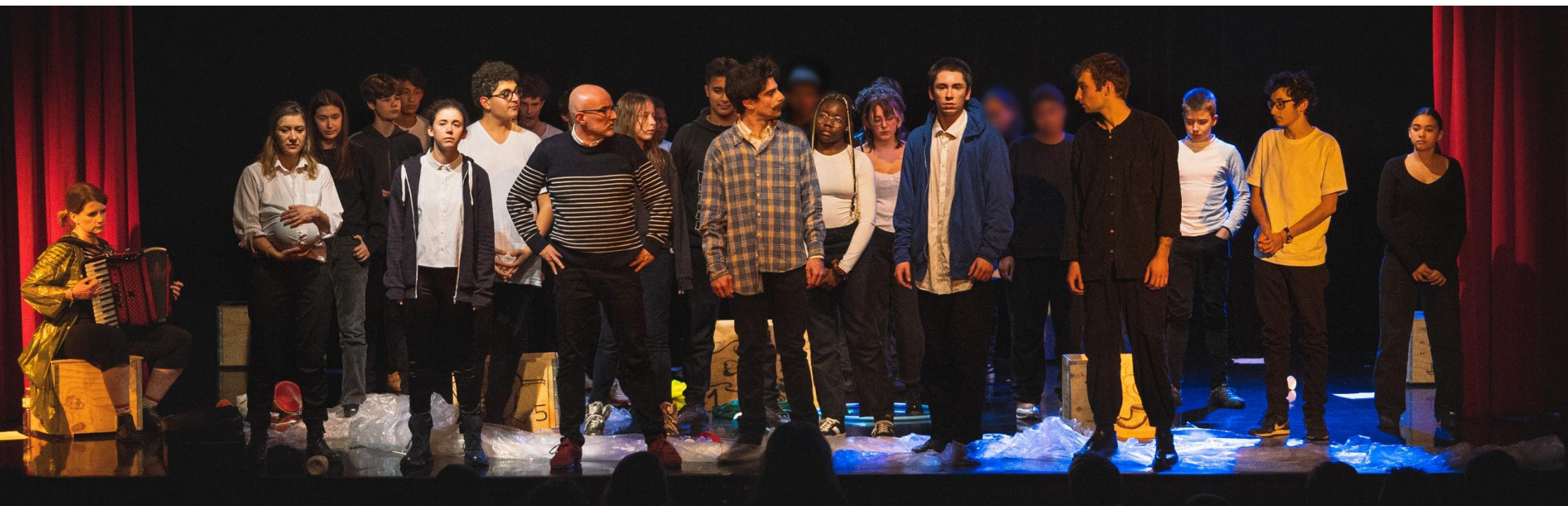
Les Somnambules du Monde qui va , épisode 1, Théâtre Douze, décembre 2023.

La compagnie peut faire appel à des comédiens amateurs. Selon le temps de répétition, les envies des participants et leur nombre, ils peuvent être amenés par exemple : à chanter la chanson du générique, à créer des marionnettes, des costumes, à jouer des rôles parlants ou non, à créer des scènes de chœur.