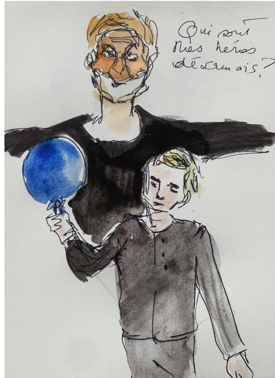
Dessin de Greta Margherita