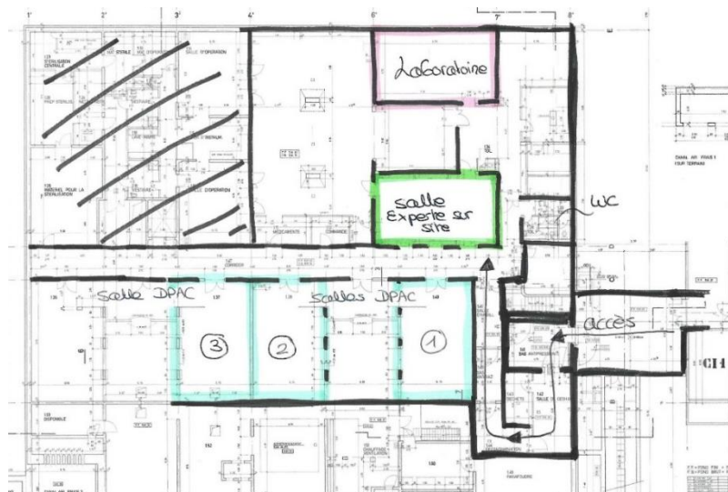
Plan intérieur de l'« Hôpital », bâtiment 4

Une fois dans le bâtiment, suivre les indications jusqu'au point de rencontre « Salle experts sur site ». La responsable de site vous accueillera et procédera au contrôle de votre identité. Durant les épreuves, vous pourrez laisser vos effets personnels dans cette salle ; possibilité de se changer sur place (voir indications sur place).