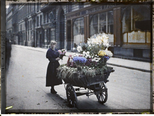
SEINE - A 44361