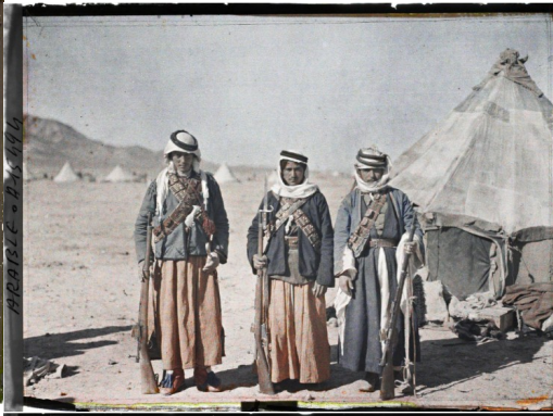
ARABIE - A 44740