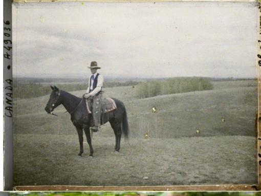
CANADA - A 43886