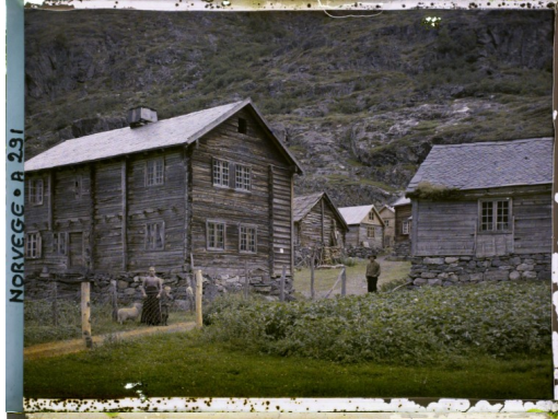
NORVEGE - A 231