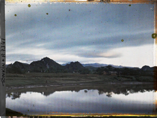
INDONISIE - A 7341