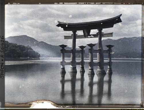
JAPAN - A 56496