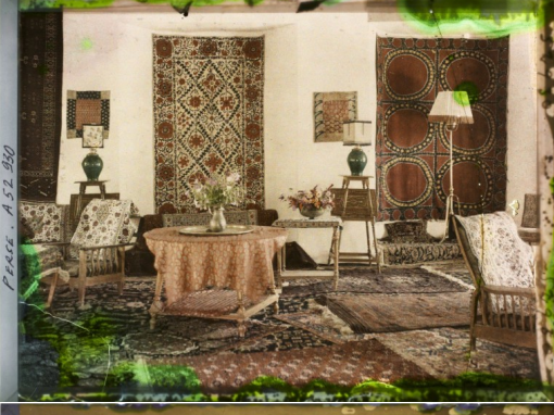
PERSE - A 52460