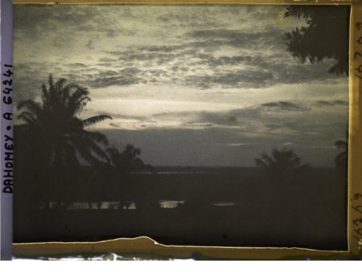
BAHREYNE - A 64241