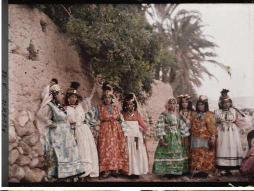
ARABIE - A 44742