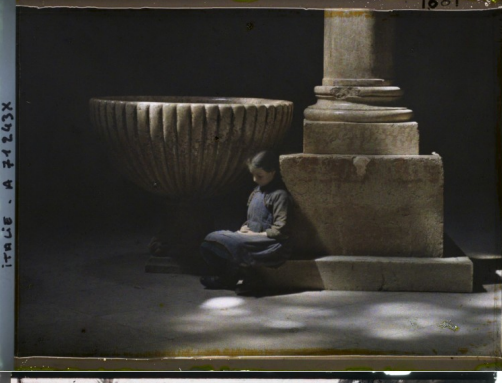
INDIE - A 24263X