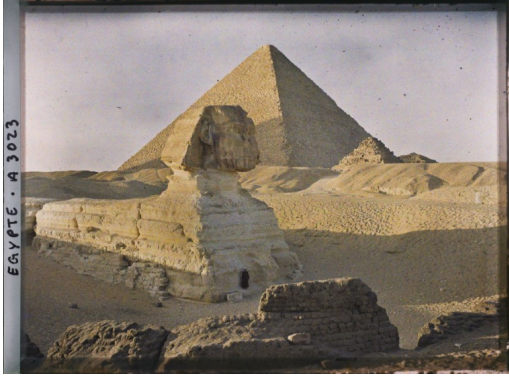
EGYPT - A 3023