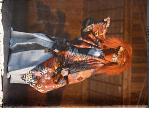
EGYPT - A 3023