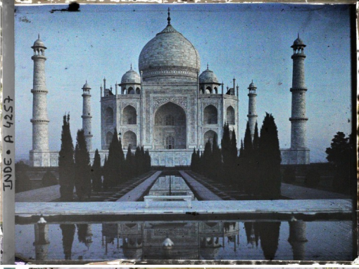
INDE - A 4257