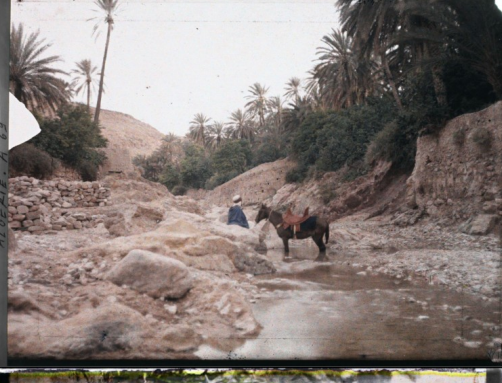
LIBYIE - A 44741