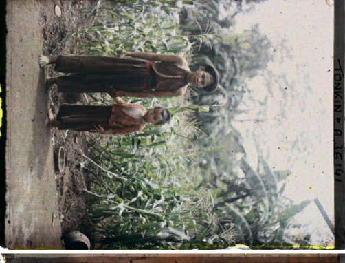
INDIE - A 24263Y