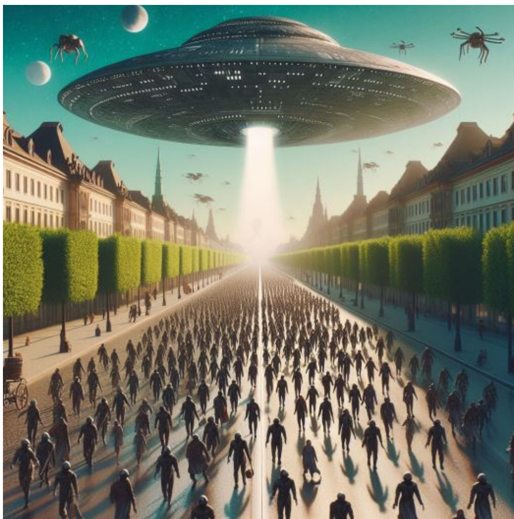
Dictature militaire.