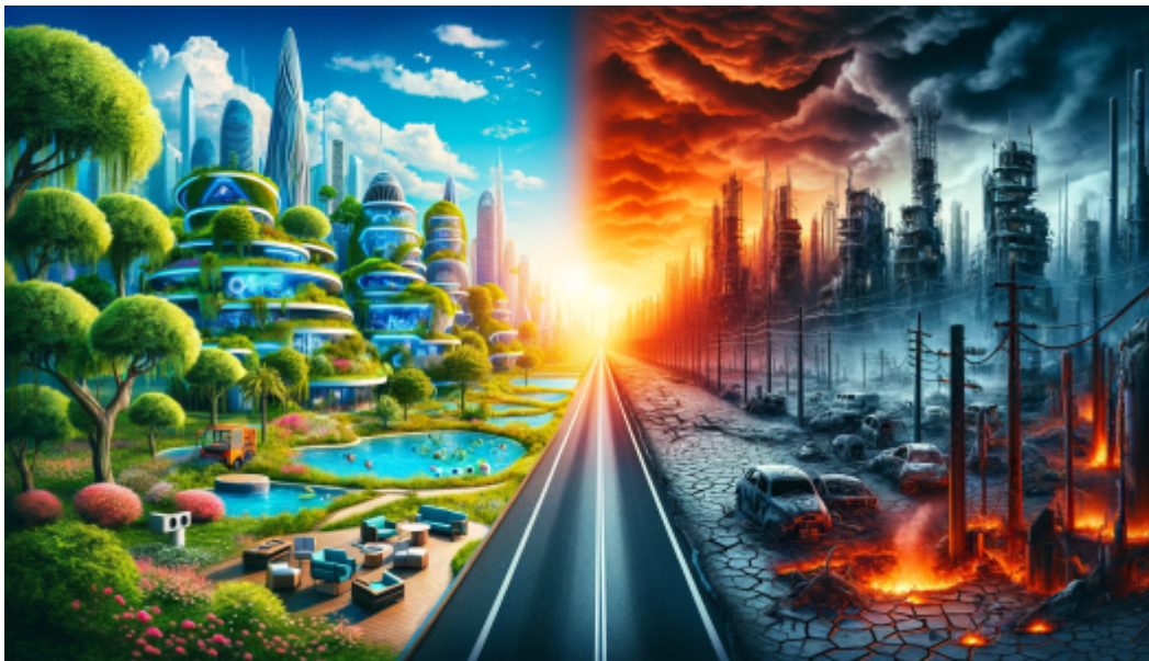
Utopie ou dystopie. Image panoramique générée par l'IA. 2022. Auteur : Monsieur Vili . Wikimedia Commons .

NEWS NEWS NEWS 2025 sera-t-elle l'année de l'entrée de l'humanité dans un monde qui ressemble aux angoissantes dystopies écologiques et politiques de la science-fiction, ou dans un monde plutôt inspiré par les romans utopiques qui fleurissent depuis quelques années, lucides sur les drames environnementaux et le recul effrayant des régimes démocratiques ? Quel imaginaire va l'emporter, sur cette planète qui se délabre, le trumpisme oligarchique et fascisant, le poutinisme sanglant, le lepénisme illibéral et le Xi-Jingisme débridés (Brrrr!), ou une alternative et laquelle ? La littérature de science-fiction (et le cinéma) joue-t-elle un rôle dans cette évolution des esprits, que ce soit en mettant en scène les plus inquiétants dérapages de notre futur, en les sondant, en nous mettant en garde, ou en concevant des sociétés ou d'autres planètes plus « respirables » dans tous les sens du terme ?