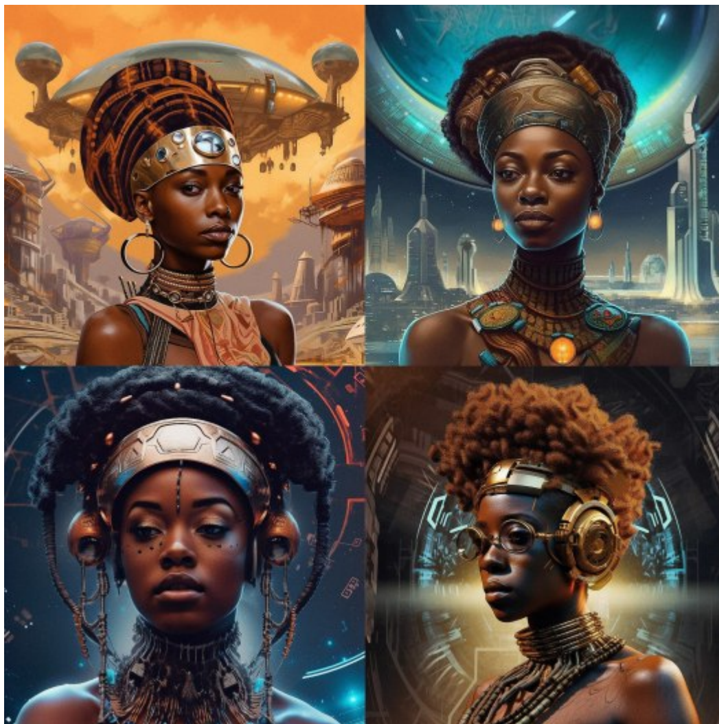
Afrofuturisme. Auteur: Raenisha28 . WikimediaCommons