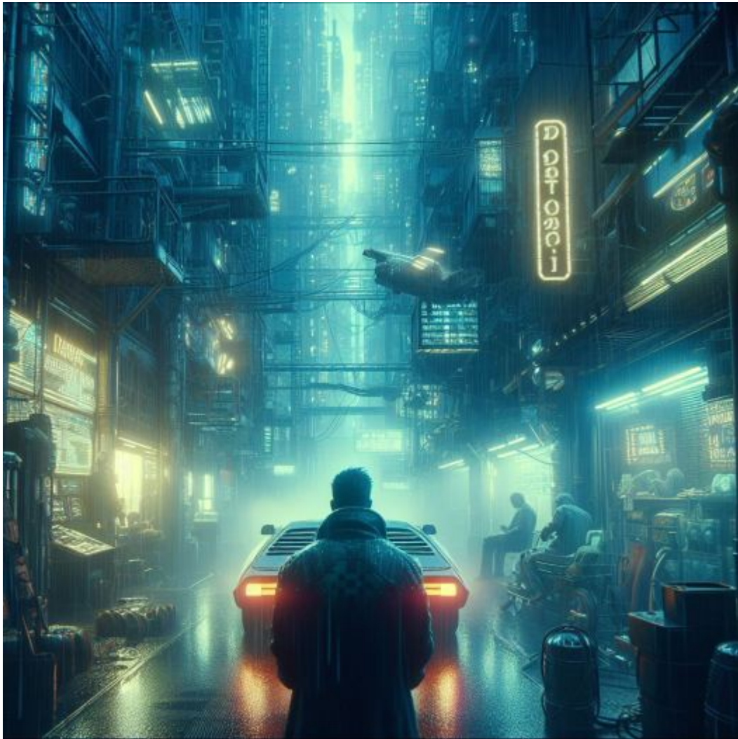
Des villes futuristes dures. Image inspirée par le film Blade Runner générée par Midjourney. Auteur : Dennis Sylvester Hurd. Wikimedia Commons