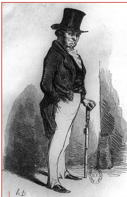
Vautrin, gravure de Daumier.

– les personnages anaphoriques (ils font référence au système de l'œuvre, comme les pronoms, par exemple, sont les signes qui renvoient à des énoncés déjà formulés) : ils permettent de construire la cohérence, voire la redon-