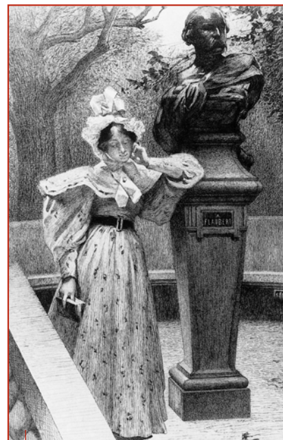
Frontispice pour une édition de Madame Bovary .

Mauriac affirmait, lui, que seuls ses personnages secondaires pouvaient avoir été empruntés à la vie et formulait la règle selon laquelle moins un personnage a d'importance dans le récit, « plus il a de chances d'avoir été pris tel quel dans la réalité ». Pour les autres, s'il a toujours situé ses personnages dans son milieu