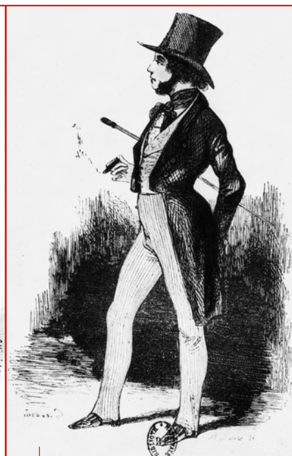
Rastignac, lithographie de Gavarni.

dance de l'œuvre ; ce sont, par exemple, ceux qui jouent le rôle de prédicateurs ou d'informateurs.