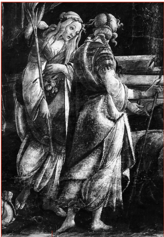
Zéphora, détail de « Les deux filles de Jéthro » de Botticelli. Chapelle Sixtine, Rome.

démarche est la même : le portrait est l'occasion de mettre à l'épreuve l'individualité d'un être , extraite d'une série ou rapportée à une généralité qui l'englobe et la dépasse.