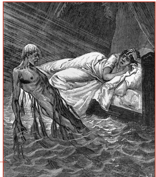
Thérèse Raquin, gravure de Casztelli.

Ce « grossissement », chez Balzac, répond également à un souci de généralisation et d'explication : le personnage, quelque « individualisé » qu'il soit, tend le plus souvent au « type ». Dans la préface à Une ténébreuse affaire (1842), Balzac définit le type comme « un personnage qui résume en lui-même les traits caractéristiques de tous ceux qui lui ressemblent plus ou moins [...] ». Il n'est pas un emprunt direct au réel, mais au contraire une transposition de la réalité qui tend à la généralité. Le type est donc un facteur essentiel de vraisemblance , tant il est vrai, pour Balzac, que le roman doit corriger la vérité parfois trop scandaleuse que la vie réelle place sous nos yeux. En « typant » un individu, Balzac l'arrache à sa singularité parfois invraisemblable et le leste d'un poids de vraisemblance et de généralité qui en font un principe explicatif (du fonctionnement de la société, du cœur humain, etc.). Comme il l'écrit à madame Hanska