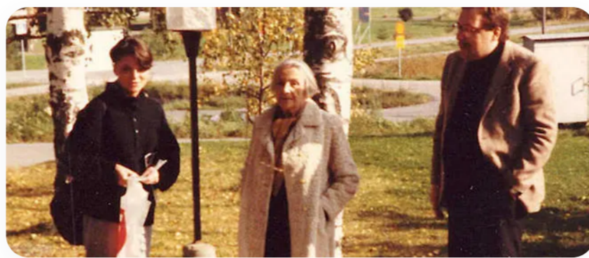
Nathalie Sarraute en 1983.

tropismes, explique-t-elle, sont ces " mouvements indéfinissables qui glissent très rapidement aux limites de la conscience ; ils sont à l'origine de nos gestes, de nos paroles, des sentiments que nous manifestons, que nous croyons éprouver et qu'il est possible de définir ". L'art de Nathalie Sarraute consiste à inventer un langage qui puisse exprimer cet infiniment petit , en perpétuelle migration, et qui est la source secrète de notre existence. Son souhait est de révéler les mouvements fugaces de notre conscience, tous les « drames microscopiques » qui forgent secrètement les relations humaines. Même si le langage a du mal à en rendre compte, c'est le seul moyen de les exprimer.