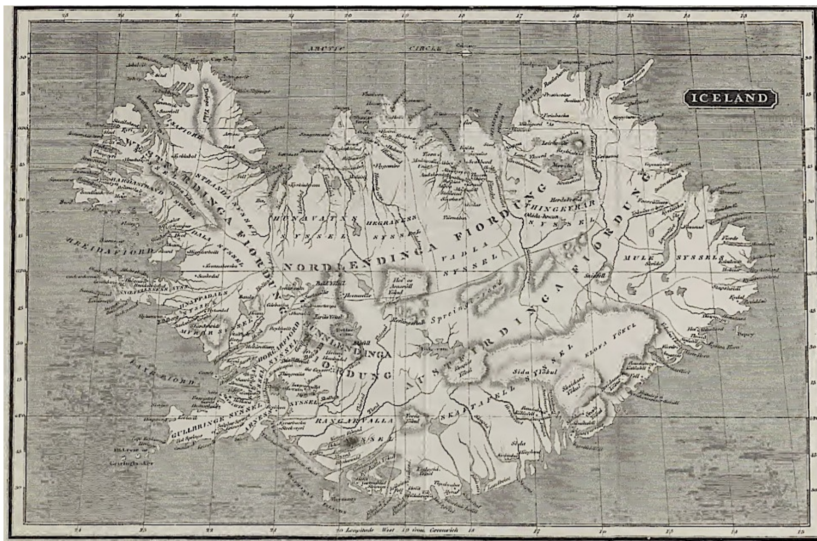
La carte de l'Islande figurant dans l'ouvrage d'Ebenezer Henderson (1818). « Voici une des meilleures cartes de l'Islande, celle d'Henderson. » (VCT, Chap. VI.)

La carte de l'Islande, d'après les relevés de Gunnlaugsson, dessinée par Petermann et gravée par Swanston (1850). « J'ai précisément reçu, il y a quelque temps, une carte de mon ami Augustus Petermann de Leipzig » (VCT, Chap. VI.)