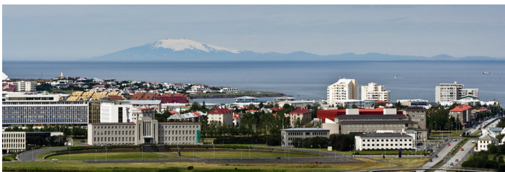
Le Snæfellsjökull vu de Reykjavik (photographie récente), à 120 km à vol d'oiseau.

« Le Snæfellsjökull, glacier voisin de Reykiavik, le plus haut glacier qui existe en Islande. Vue prise de Reykiavik, à minuit. » (Gaimard 1838 - Atlas historique, Pl. IV - dessin de M. A. Mayer). [Le reflet du Soleil sur la mer le place au Nord-Ouest, avant son coucher ; ce qui situe la vue en fait avant minuit (ou était-ce minuit à l'heure de Paris — 1h30 plus tard — conservée par le chronomètre des marins ?). L'intérieur de l'Islande recèle des glaciers plus élevés que le Snæfellsjökull.] [Auguste Étienne Mayer (1805-1890), peintre de marine, professeur de dessin à l'École navale de Brest.] « Mais avant de quitter le pont de la goelette, il m'entraîna à l'avant, et là, du bout du doigt, il me montra, à la partie septentrionale de la baie, une haute montagne à deux pointes, un double cône couvert de neiges éternelles. Le Sneffels ! s'écria-t-il, le Sneffels. » (VCT, Chap IX, l'arrivée à Reykjavik)