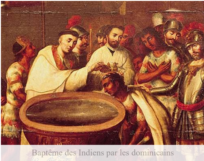
Baptême des Indiens par les dominicains

De toute façon, les abus se généralisent, provoquant l'indignation de Bartolomé de Las Casas et des essais de réforme (1542, Nuevas Leyes de Charles Quint). La politique officielle d'assimilation impliquait l'effort d'éducation et d'évangélisation. Dès 1508, les Rois Catholiques obtiennent le patronage de l'Église des Indes. De 1512-1513 (création des trois évêchés dans les îles) à 1546 (Lima et Mexico érigés en archevêchés), plusieurs dizaines d'évêchés sont créés.