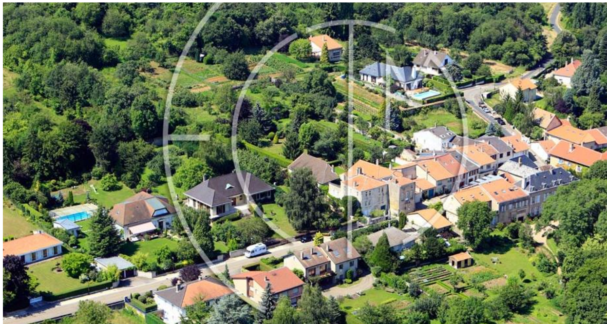
Document 4 : Plapeville, une commune périurbaine située à 10 km de Metz. Photographie aérienne, Juillet 2012