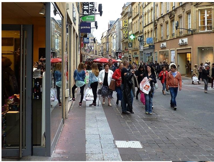
Document 2 : Une rue piétonne, dans le centre-ville de Metz.