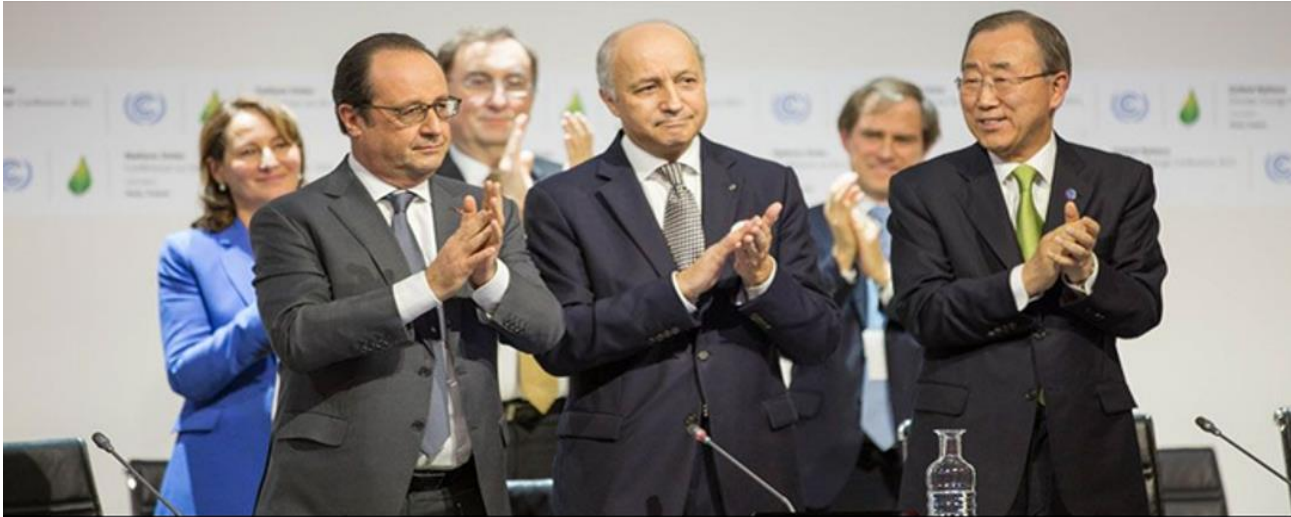
Photographie prise au Bourget (proche de Paris) le 11 décembre 2015 lors de la COP 21

Le président de la république française François Hollande, le président de la COP 21 Laurent Fabius et le secrétaire général de l'ONU Ban Ki-moon se félicitent de l'accord trouvé.