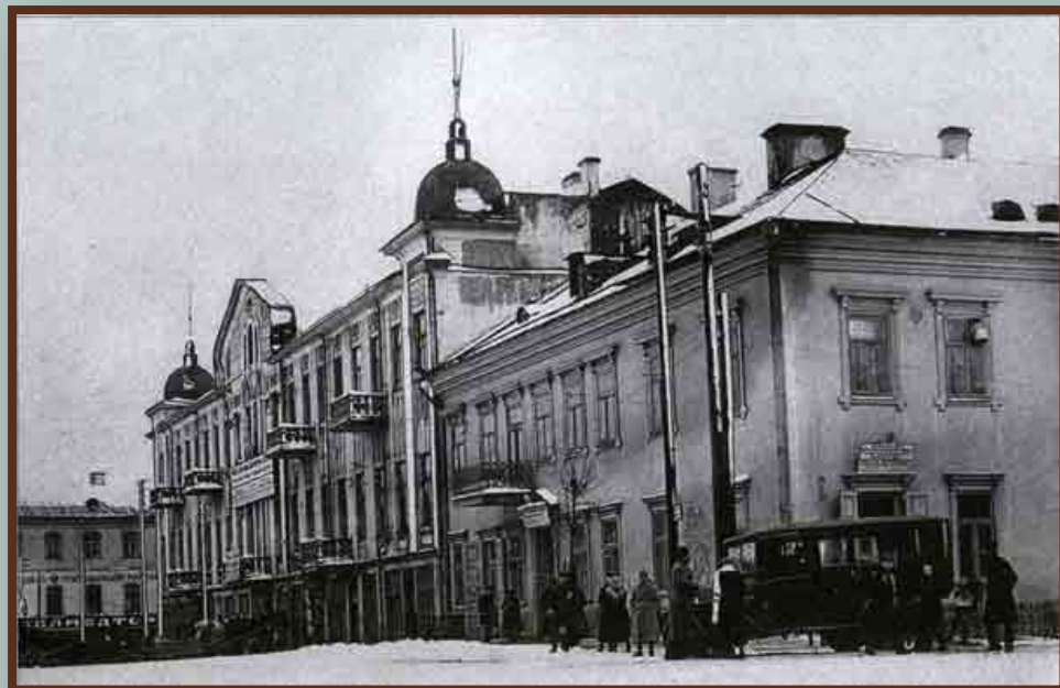
Здание Минского городского Совета. 1920-е гг.

Коренизация – одно из основных направлений политики белорусизации, предусматривающее повышение роли лиц коренной национальности в общественно-политической жизни республики, выдвижение кадров из коренного населения на партийную, советскую, хозяйственную и общественную работу.