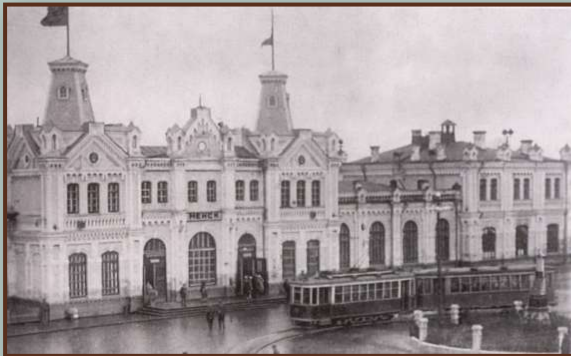
Вокзал станции Минск-Пассажирский. Первая половина 1920-х гг.

Белорусизация – политика национально-государственного и национально-культурного строительства в БССР в 1920-е гг.