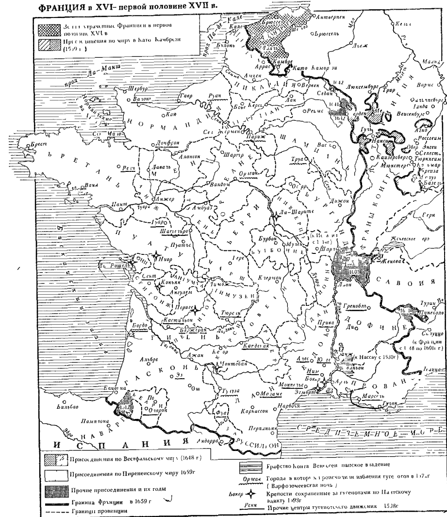
ФРАНЦИЯ в XVI — первой половине XVII в.

Понятно, что при таких условиях религиозный вопрос о делении на гугенотов и католиков имел скорее второстепенное значение. Религия была зачастую вопросом тактики, и в ходе гражданских войн