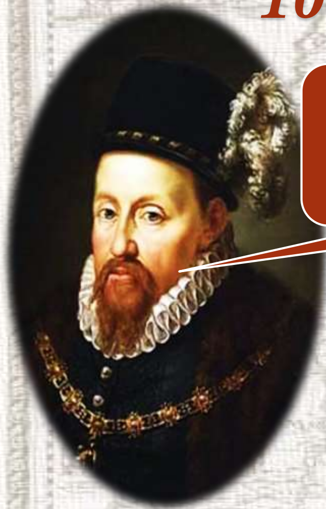
Сигизмунд II Август

Военный союз ВКЛ и Польши, общая внешняя политика