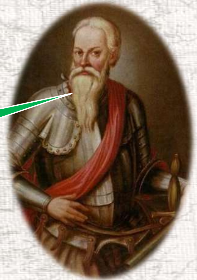
Николай Радзивил Рыжий