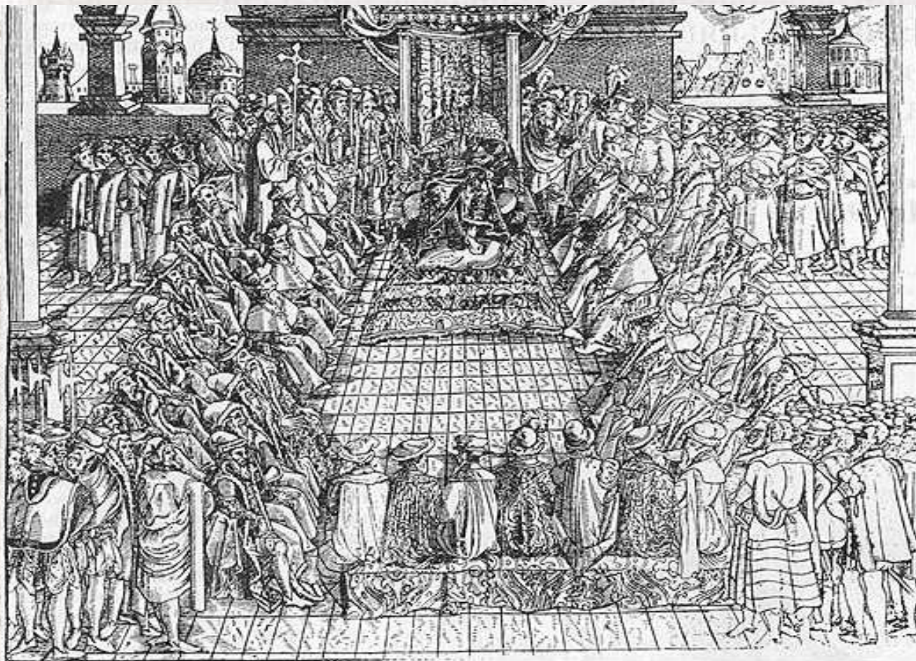
Люблінські сойм 1569 г. Гравюра XVI ст.