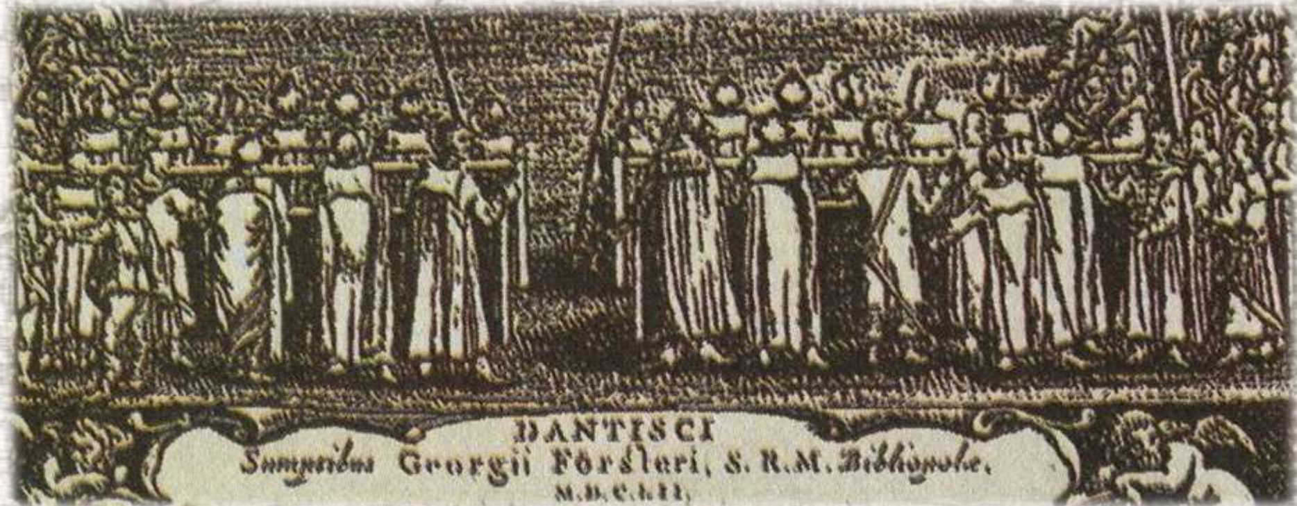
Образование Речи Посполитой. Люблинский сейм. Фрагмент гравюры 1652 г.