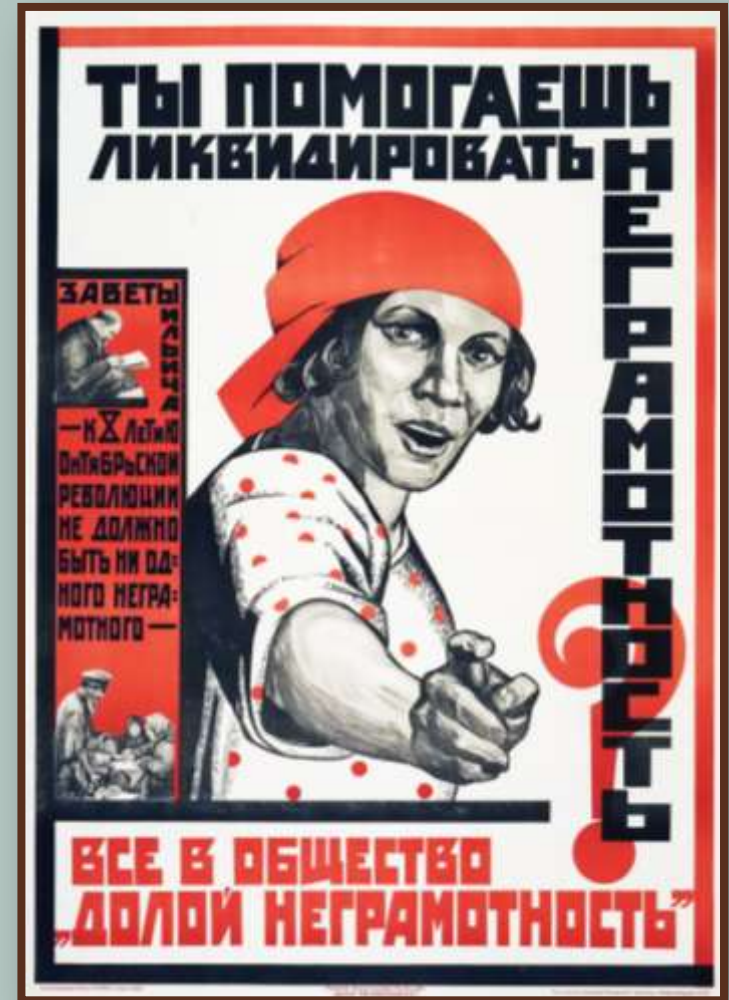
Ты помогаешь ликвидировать неграмотность? Плакат. 1920 г.

В 1926 г. в БССР оформилось общество «Долой безграмотность». Его председателем был избран А.Червяков – председатель ЦИК БССР. По инициативе комсомола проводились месячники «За грамотность», а также культпоходы и культэстафеты, в ходе которых происходило обучение людей грамоте. При городских и сельских Советах были созданы группы содействия ликвидации безграмотности, проходили городские смотры школ и пунктов по ликвидации безграмотности. В этой работе принимали участие коллективы фабрик и заводов, колхозов и совхозов, организаций и учреждений, учителя, студенты, школьники, все грамотные люди. Но к концу 1920-х гг. были сделаны только первые шаги на пути ликвидации массовой неграмотности взрослого населения. Для полного решения этой проблемы требовались дополнительные усилия государства и широких слоёв общественности в последующие годы.