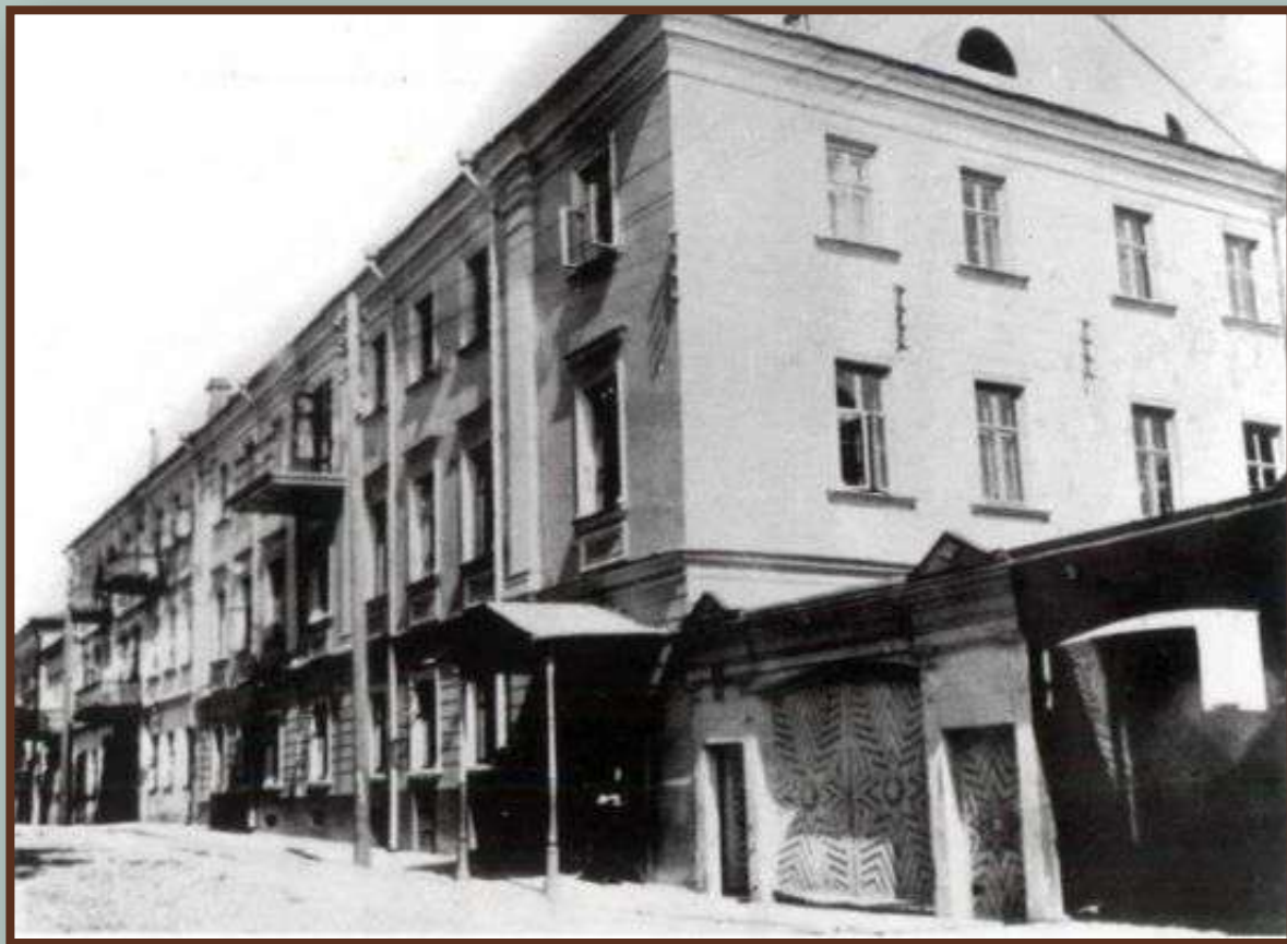
Здание Инбелкульта. 1920-е гг.

1920-е гг. стали временем рождения белорусской науки. В 1922 г. был создан Институт белорусской культуры (Инбелкульт). В 1929 г. он был реорганизован в Белорусскую академию наук, ставшую центром научной жизни республики.