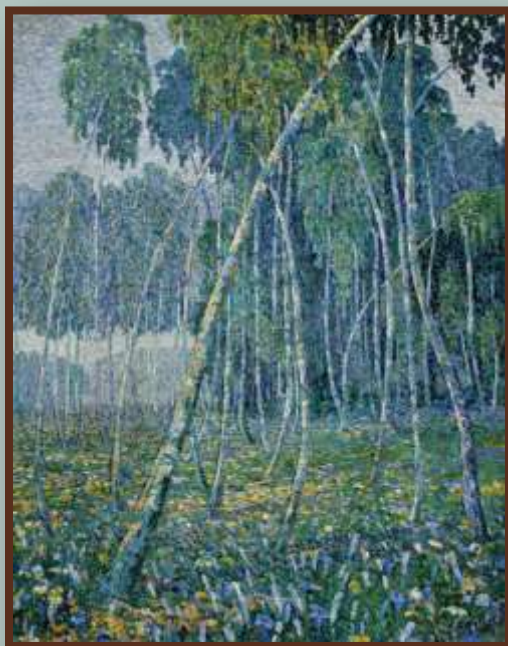
Утро весны. Худ. В.Кудревич