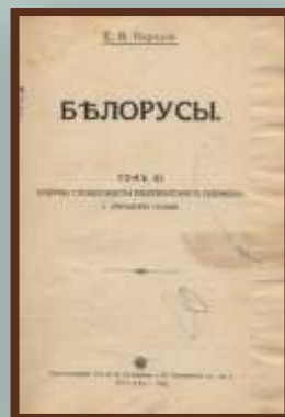
Трёхтомник Е.Карского «Белорусы».

Выдающийся учёный, филолог-славист, основатель белорусского языковедения, филологии и фольклористики, академик Российской академии наук Е.Карский создал капитальный трёхтомный труд «Белорусы». Это главное произведение в его научном наследии, памятник выдающемуся учёному, настоящая белорусская энциклопедия. В ней исследуются народная словесность, фонетика, морфология и синтаксис бело-русского языка, а также древняя и новая белорусская литература.