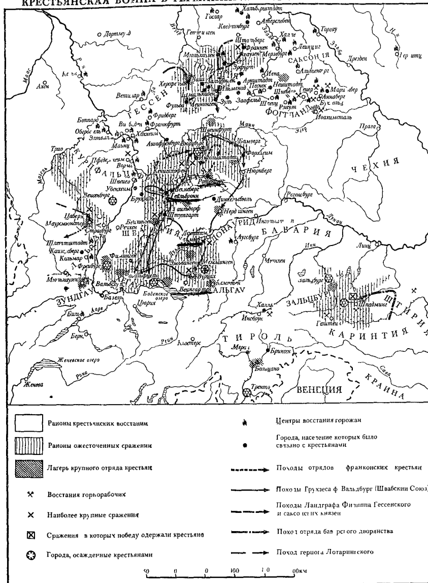
КРЕСТЬЯНСКАЯ ВОЙНА В ГЕРМАНИИ (1524-1525)

«Так как до настоящего времени, — говорится в этом документе, — на бедных простых людей городов и деревень... налагались большие тяготы со стороны духовных и светских господ и властей, которых те и мизинцем не трогали, то из этого следует, что подобного бремени и стягочения невозможно ни переносить, ни терпеть, если только простой бедный человек не хочет пустить совсем по миру с нищенским посохом себя самого, свое потомство и потомство