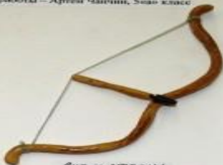
Лук и стрелы