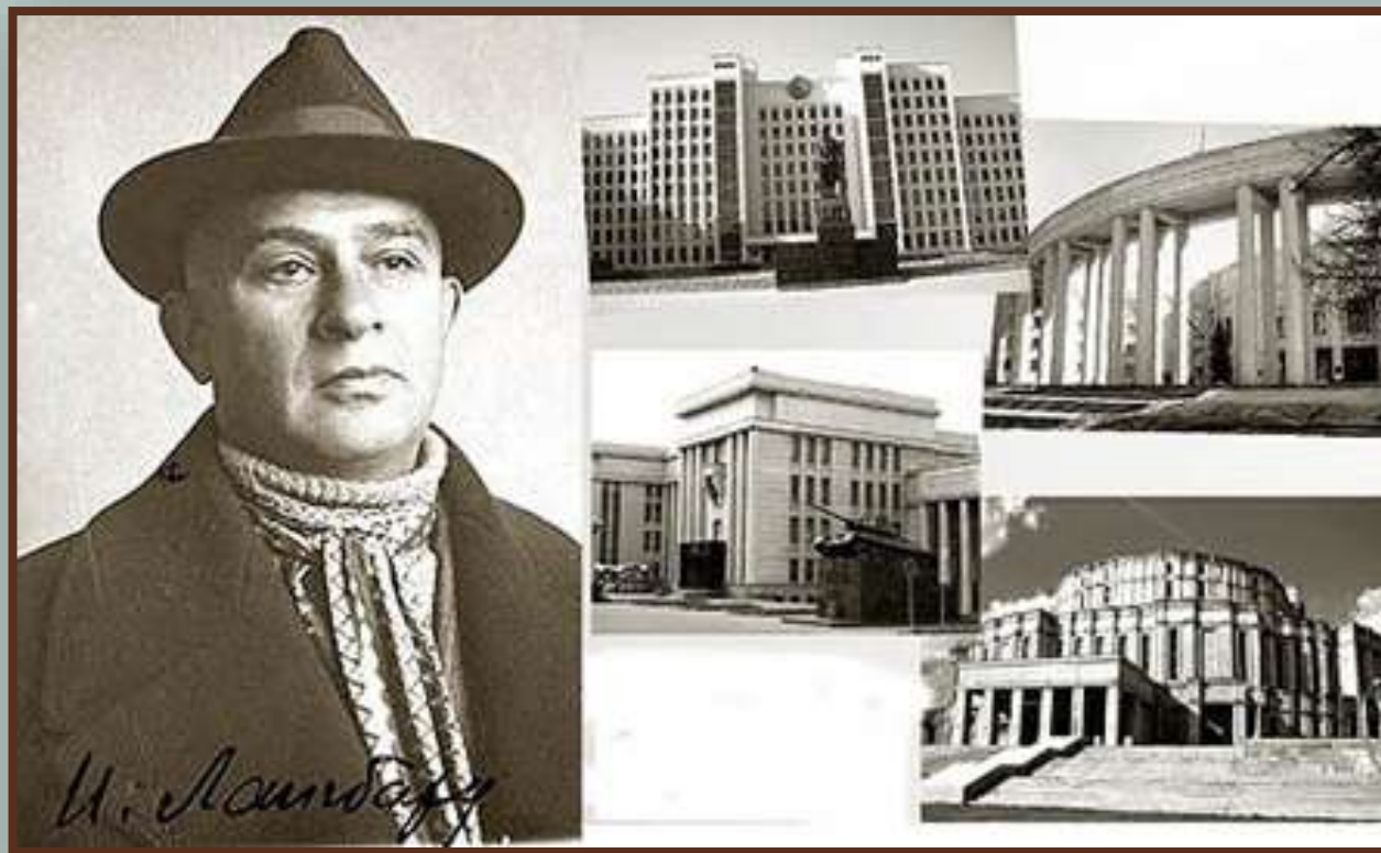
И.Лангбард и его архитектурные творения