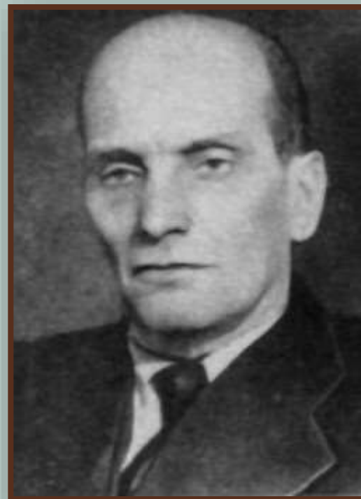
М.Климкович, первый председатель Союза писателей БССР

В 1930-е гг. была осуществлена перестройка писательских организаций. В 1934 г. в Минске состоялся I съезд писателей БССР, который создал единую писательскую организацию в республике. В конце 1920-х – 1930-е гг. в белорусской литературе плодотворно трудились Я.Купала, Я.Колас, К.Крапива, П.Бровка, М.Зарецкий, П.Глебка, М.Лыньков, К.Чорный и другие. Лучшие произведения белорусских писателей и поэтов были переведены на русский язык и языки других народов СССР.