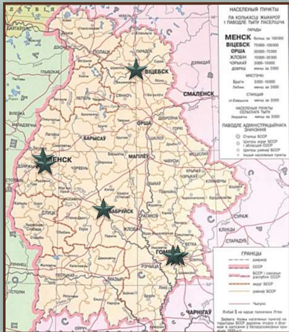
Театральное искусство БССР в 1930-е гг.

В конце 1920-х – 1930-е гг. дальнейшее развитие получило театральное искусство Беларуси. Передвижной театр, созданный в 1920-е гг., был реорганизован в Белорусский третий государственный театр с базой в Гомеле. Были созданы также Государственный русский драматический театр БССР в Бобруйске (с 1947 г. – в Минске) и Республиканский театр юного зрителя в Минске, театры рабочей молодёжи в Минске, Витебске и Гомеле, колхоз-но-совхозные театры в ряде городов республики. Всего в БССР в 1930-е гг. работало 14 театров.