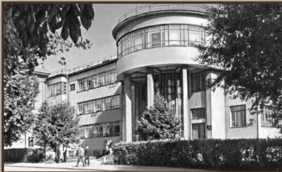
Здание государственной библиотека БССР им. В.Ленина. Арх. Г.Лавров