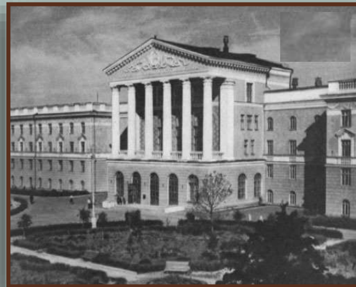
Здание главного корпуса Белорусского политехнического института. Арх. И.Запорожец, Г.Лавров

По проектам архитектора Г.Лаврова были построены государственная библиотека БССР им. В.Ленина и главный корпус Белорусского политехнического института, а по проекту И.Запорожца и Г.Лаврова – университетский городок в Минске. В 1939 г. началось возведение здания Центрального Комитета Компартии (большевиков) Беларуси (сейчас резиденция Президента Республики Беларусь).