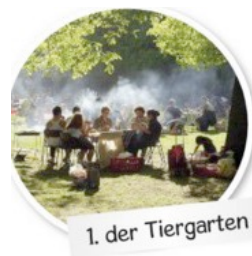
1. der Tiergarten