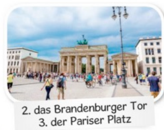
2. das Brandenburger Tor 3. der Pariser Platz