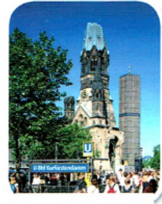
7. der Kurfürstendamm