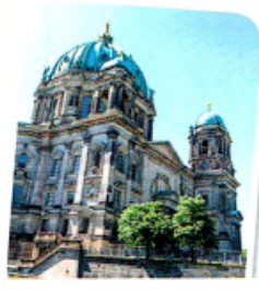
5. der Berliner Dom