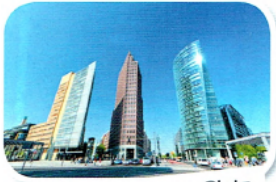
4. der Potsdamer Platz