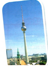
6. der Fernsehturm