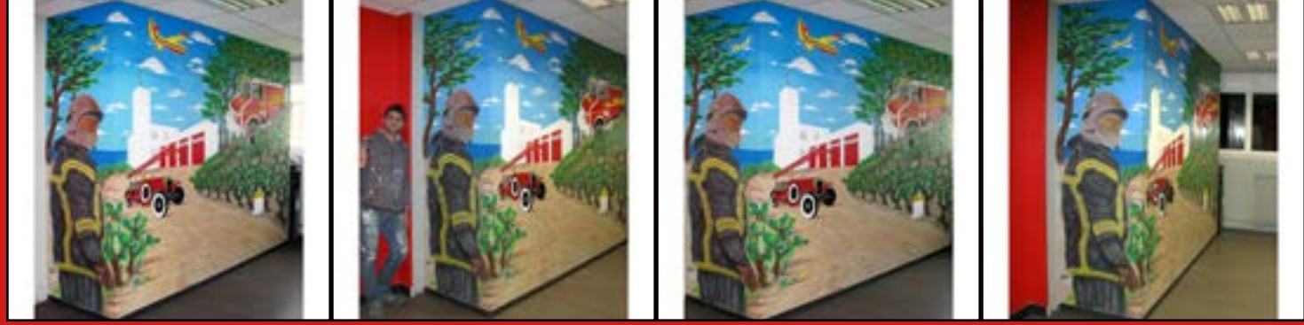
+retouche et recadrage

Recadrage et montage des photos pour la fresque murale des pompiers