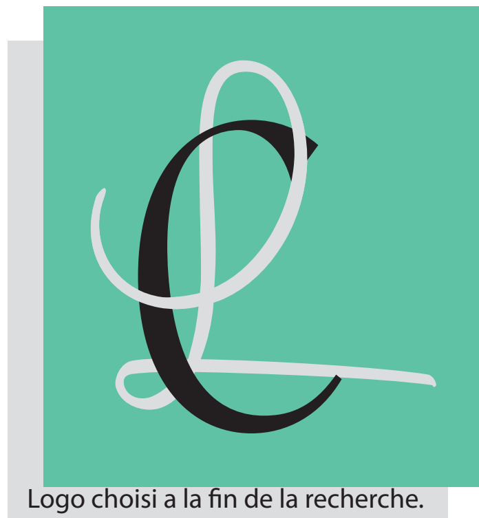
Logo choisi a la fin de la recherche.