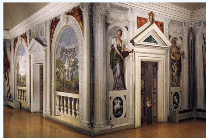
Les différents trompe l'oeil réalisés par Paul Véronèse dans la Villa Barbaro, architecte Andrea Palladio en 1550 et 1560.

Se repérer dans les domaines liés aux arts plastiques, être sensible aux questions de l'art: Utiliser le vocabulaire des arts plastiques.