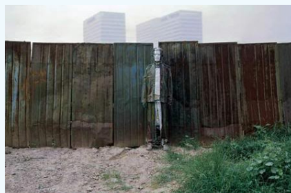
Liu Bolin et ces séries photographiques (China Report - 2007, Hiding in New York - 2011, Hiding in the City).