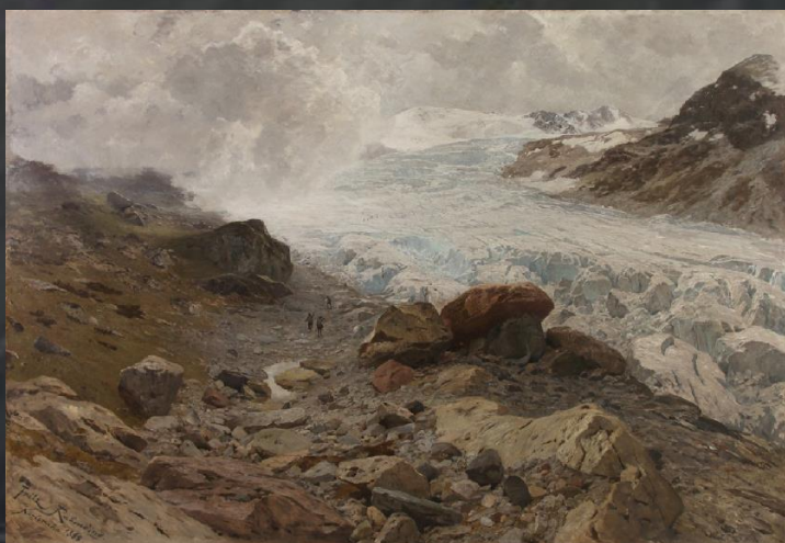
Le Glacier de Gepatsch dans les Alpes de l'Oetzal, Friedrich Wilhem