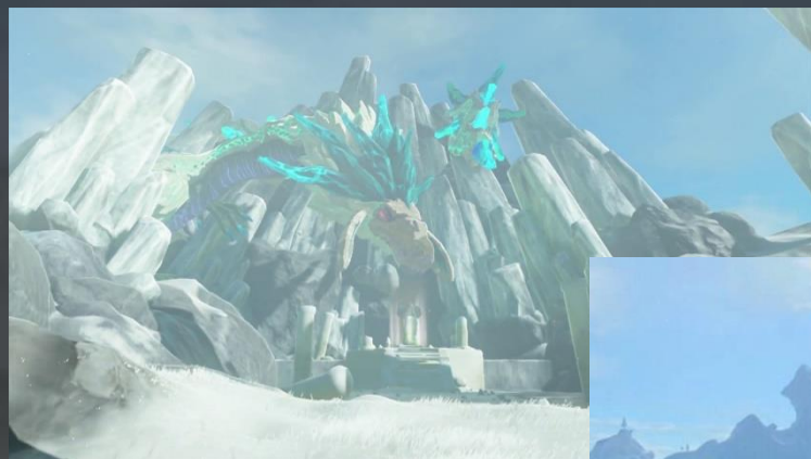
Montagne de Lanelle et Pic de la chaîne D'Hebra, Zelda Breath of the Wild