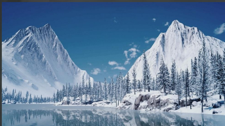
Vallée de la Glacéenne, Final Fantasy XV