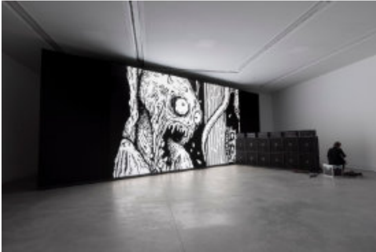
Desastres, Marco Fusinato (pavillon australien)