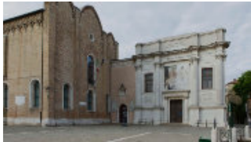
Galleries de l'Académie de Venise