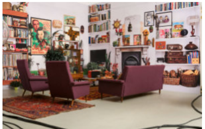
Zineb Sedira, Rêves n'ont pas de Titre (pavillon français)