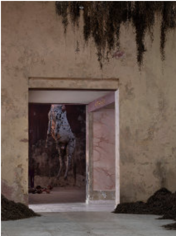
Uffe Isolotto, We Walked the Earth (pavillon danois)