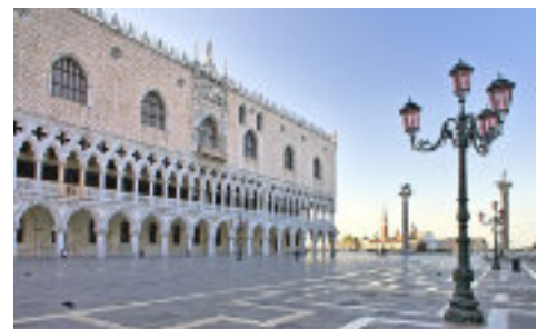
Palais des Doges