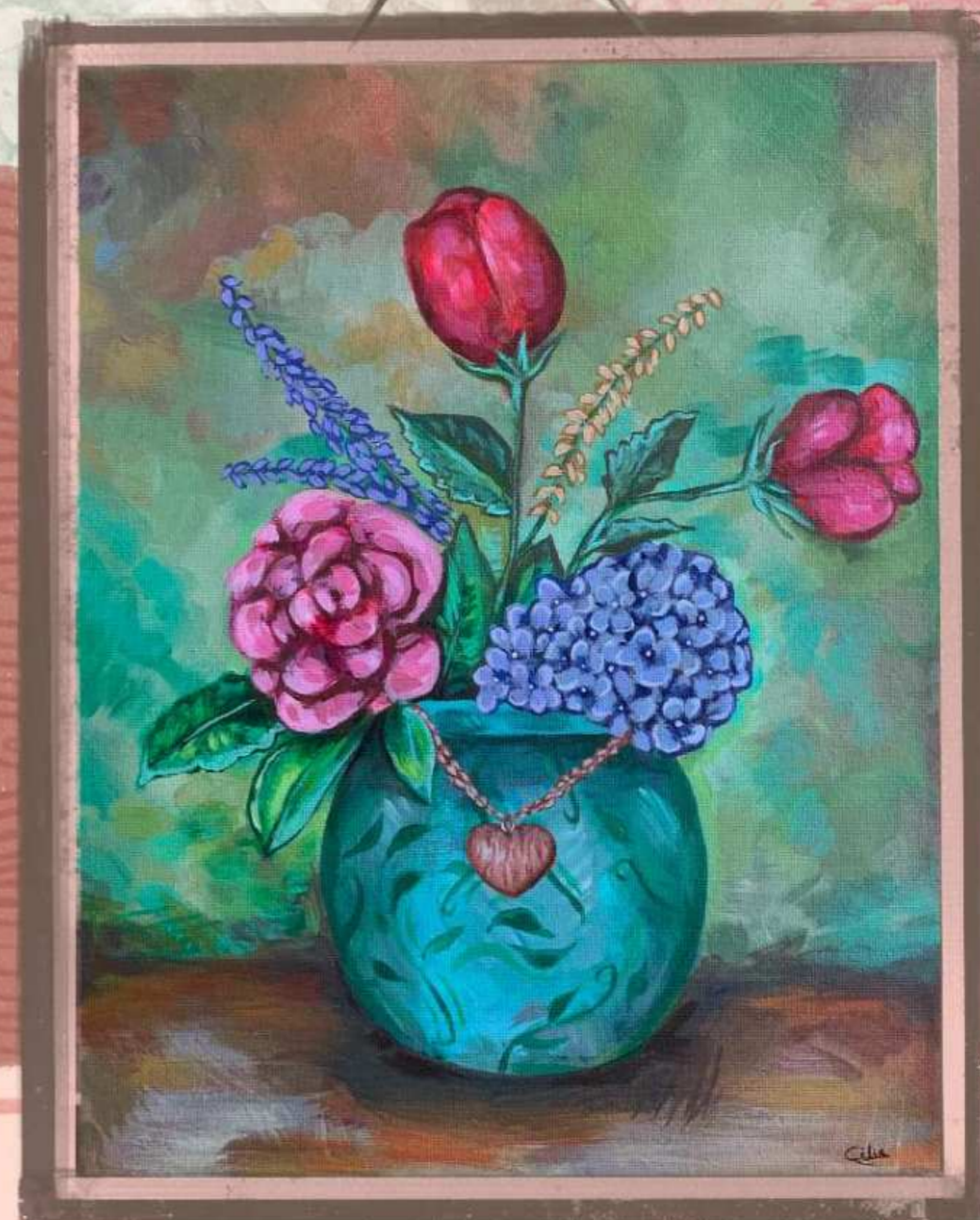
Peinture florale, à l'acrylique. 32x24cm.