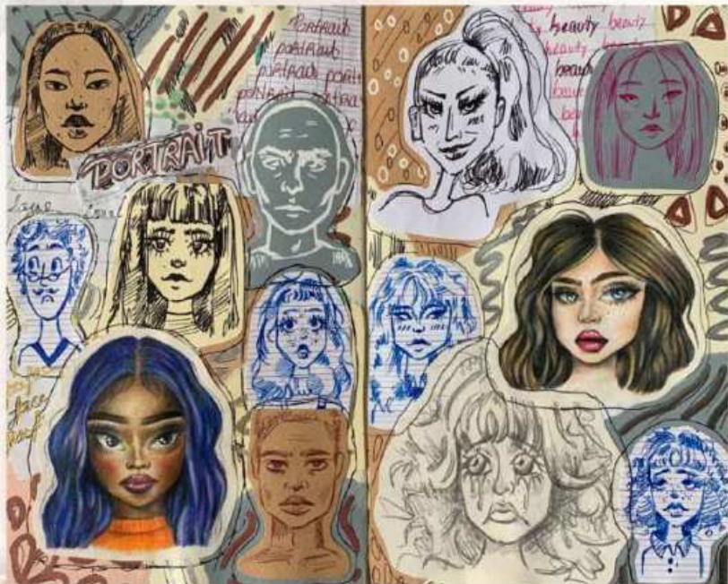
Collage réalisé à partir de divers croquis.