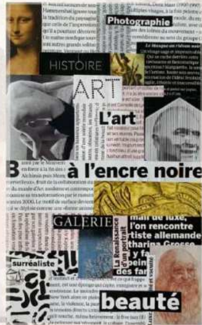
Collage à partir d'éléments découpés dans un catalogue d'art.