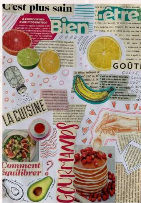
Collages sur feuilles A4 à partir d'éléments découpés dans des magazines, sur le thème de la mode et de la cuisine.