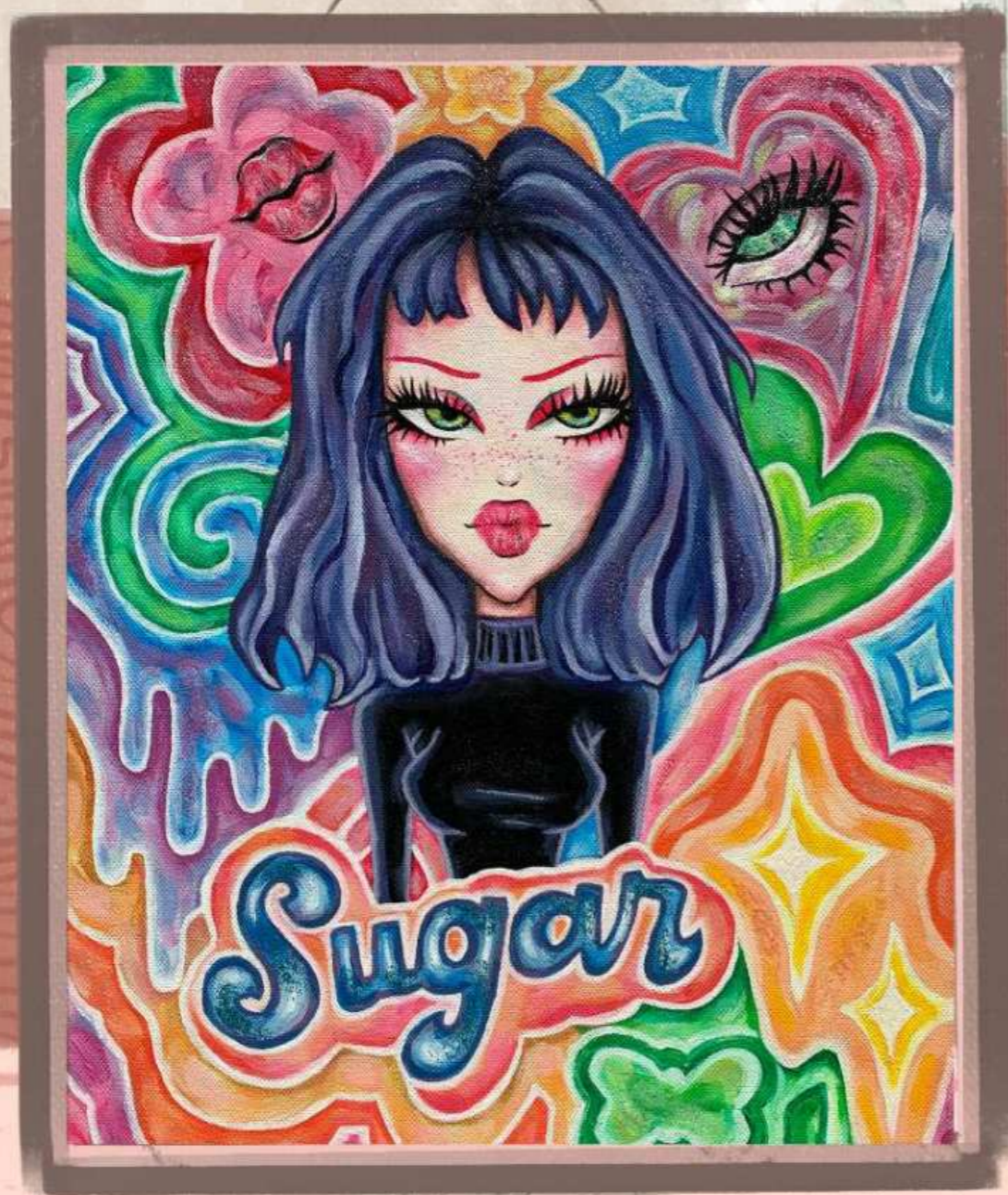
Portrait figuratif à l'acrylique, fond suggérant des formes colorées et décoratives. 41x33cm.