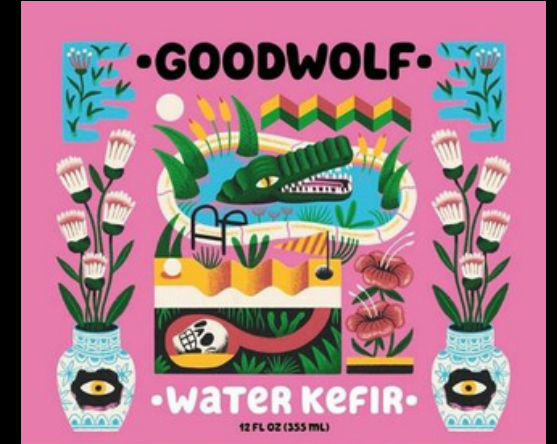
LOIC LUSNIA, 2022