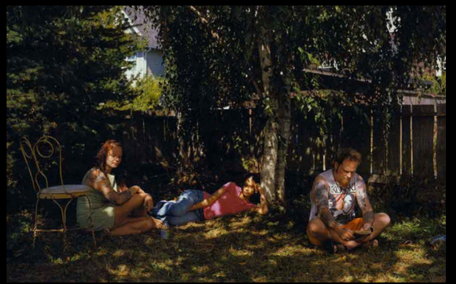
JEFF WALL, 2000