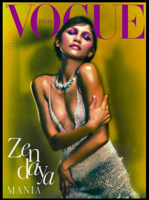
JUILLET 2022, N°862