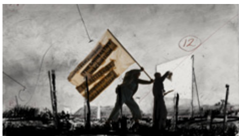
« More Sweetly Play the Dance », installation, 7 projecteurs vidéo HD et quatre mégaphones © William Kentridge, 2015

Camille Bonnet +33 (0)3 88 23 63 11 camille.bonnet@stimultania.org