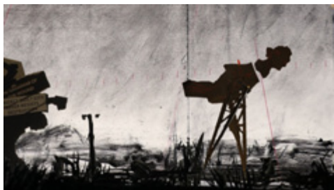
« More Sweetly Play the Dance », installation, 7 projecteurs vidéo HD et quatre mégaphones © William Kentridge, 2015