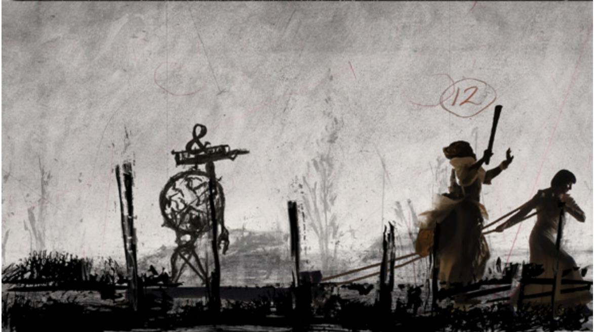
« More Sweetly Play the Dance », installation, sept projecteurs vidéo HD et quatre mégaphones © William Kentridge, 2015