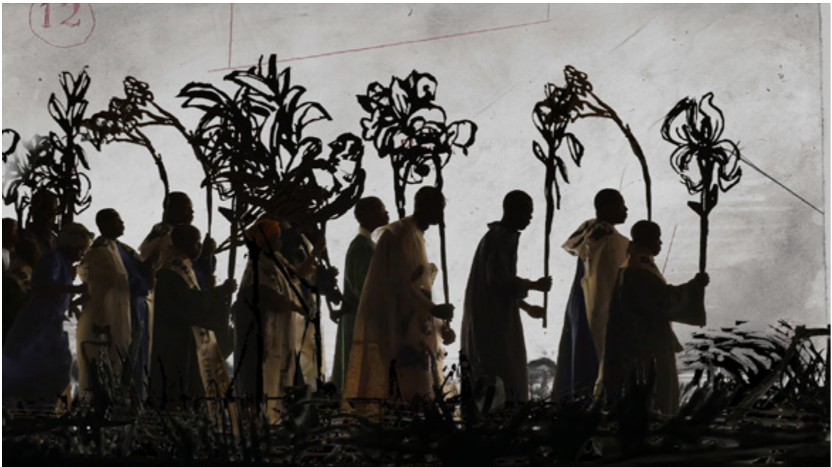
« More Sweetly Play the Dance », installation, sept projecteurs vidéo HD et quatre mégaphones © William Kentridge, 2015