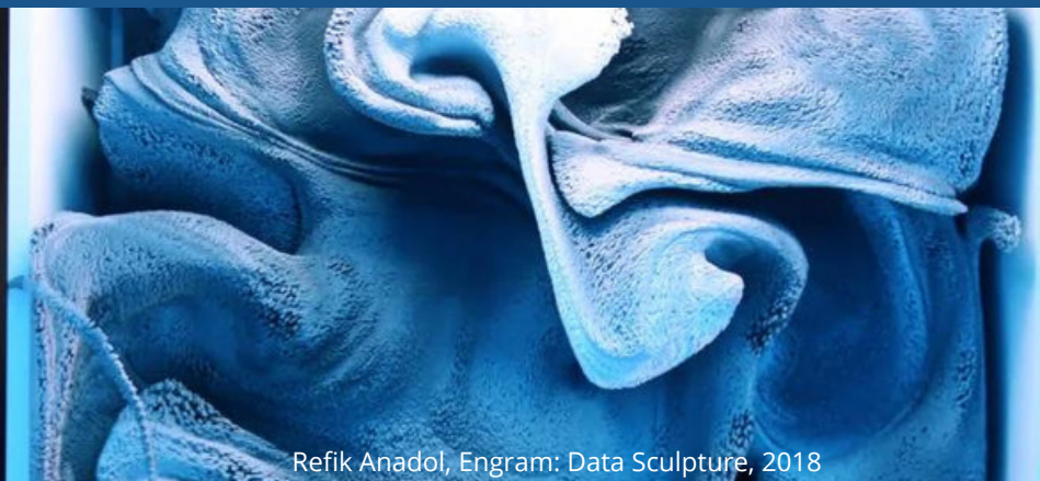
Refik Anadol, Engram: Data Sculpture, 2018