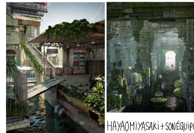
HAYAOMIYASAKI + SONÉQUIPE, Claude Monet, Photos!