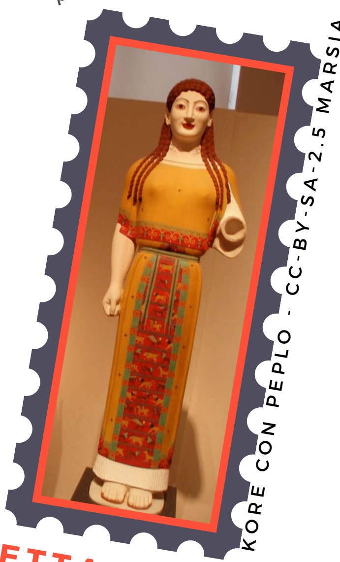
KORE CON PEPLO

il fatto che queste sculture fossero collocate in spazi architettonici anch'essi policromi, oggi scomparsi.