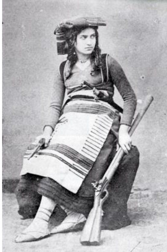
Le armi e l'atteggiamento di un capo