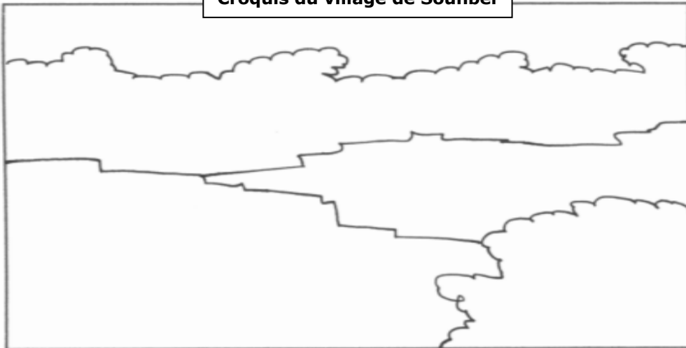
Croquis du village de Sounbel

2. En utilisant le début de la vidéo, colorie le croquis et complète sa légende :