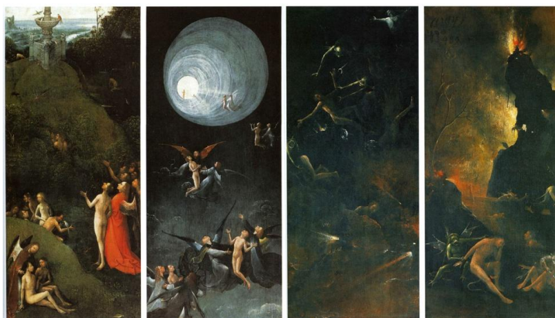
Jérôme Bosch, Vision de l'au-delà , 1504 (polyptyque)

L'usage des couleurs chaudes, comme le rouge et l' orange , renvoie aux couleurs du feu , du sang . On peut y percevoir une référence à l'histoire de l'art et aux représentations infernales dépeintes par Jérôme Bosch , notamment.