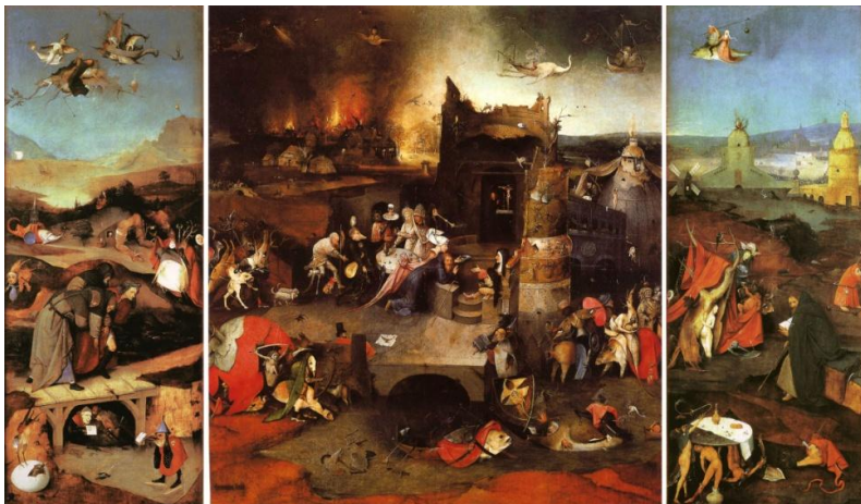
Jérôme Bosch, La tentation de Saint Antoine , 1506 (triptyque).

On voit ici comment Otto Dix puise dans la tradition iconographique en empruntant le vocabulaire des peintres de la Renaissance. Le traitement de la couleur chez Otto Dix, dans son triptyque, évoque les tons sombres et chauds employés par Jérôme Bosch dans ses représentations.