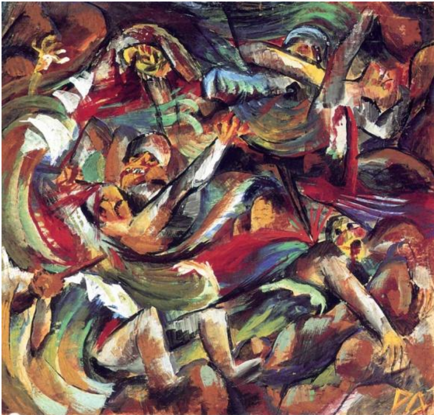
Otto Dix, Tranchée , vers 1918.

La notion de mouvement est ici importante : la distorsion des corps est manifeste, elle introduit une dynamique dans la composition ; les corps des soldats semblent soumis à une force inconnue, ils sont comme happés par la tranchée, de laquelle ils semblent être les prisonniers. Ils ne sont pas individualisés mais forment une sorte de masse compacte : cela contribue à les déshumaniser . Ainsi le peintre nous montre les conséquences de la guerre sur ces soldats, désormais privés de leur identité . L'usage de couleurs vives met en jeu des contrastes forts : les tons froids tels que le vert et le bleu font ressortir le rouge du sang , attirant l'attention sur la souffrance des soldats, dont les plaies sont multiples.