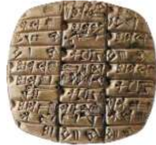
Tablette d'argile retrouvée à Ur datant de 2400 avant JC

Les premiers signes utilisés par cette écriture sont des pictogrammes.