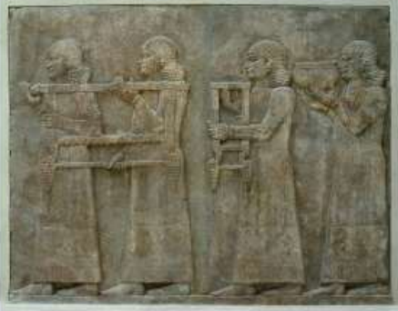
Doc A : les serviteurs et ...