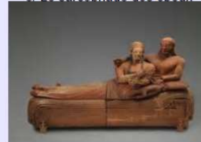
3/ Le sarcophage des époux