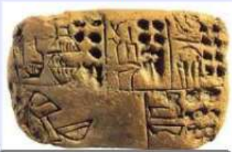
Doc 1 : salle 1 / (vitrine 3) une tablette comptable