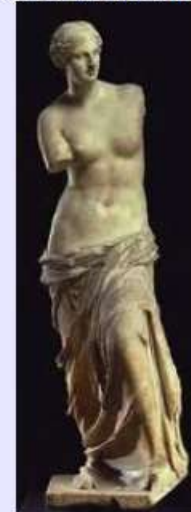
2/ La vénus de Milo