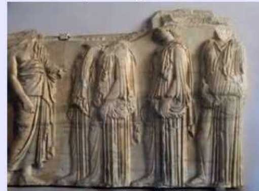
1/ Les Ergastines