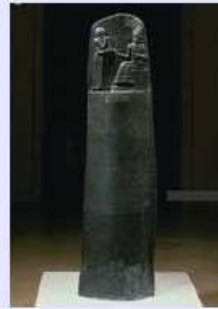
Doc 2 bis : salle 3/ une stèle « le code Hammurabi » + détail : partie inférieure