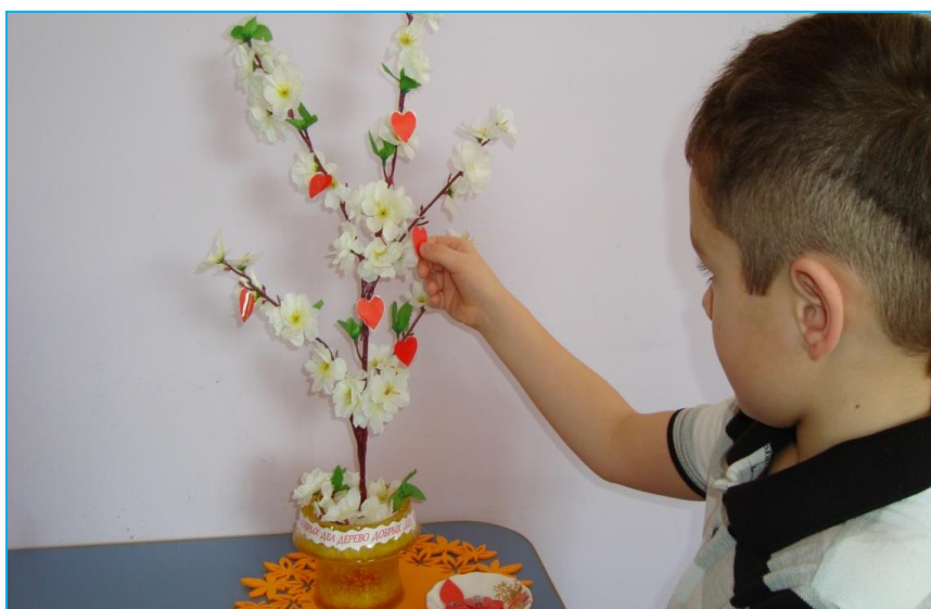
«ДЕРЕВО ДОБРЫХ ДЕЛ»

30. Помирись со мной, дружок. Скушай сладкий пирожок. Вместе мы: и ты, и я, Неразлучные друзья.