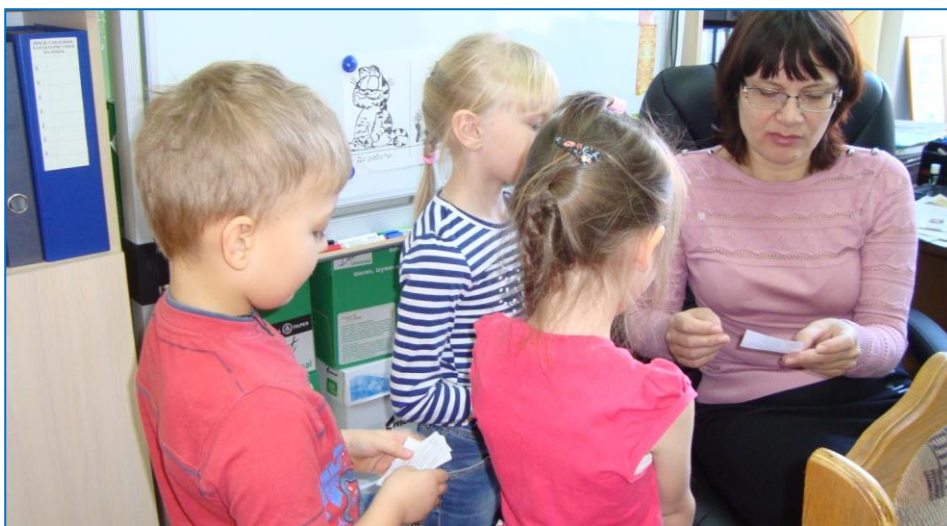
Дарили смайлики – звенья цепочки доброты