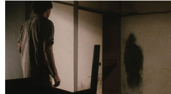
< Kiyoshi Kurosawa, Kairo , 2001, 118 min.

Les silhouettes laissées sur les murs renvoient à l'imagerie de Hiroshima, faisant de Kairo une méditation sur la mémoire collective et les traumatismes enfouis.