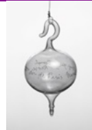
Marcel Duchamp, Air de Paris, 1919-1964, verre et bois, 14,5 x 8,5 x 8,5, Paris, Centre Pompidou, Musée national d'art moderne-Centre de création industrielle