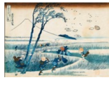
Katsushika Hokusai, "Ejiri dans la province de Suruga", série des « Trente-six vues du mont Fuji », vers 1831, Nishiki-e • 25,4 x 37,3 cm • Collection Georges Leskowitz