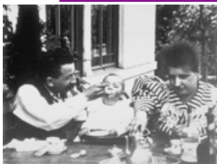
Louis LUMIERE (1864-1948), Le Repas de bébé , 1895, film noir et blanc, 41 secondes.