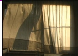
Michael Snow, Solar Breath (Northern Caryatids) , 2005, vidéo couleurs, 60 min,