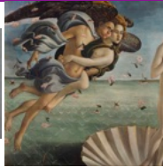
Botticelli Sandro, La naissance de Vénus, vers 1484, détrempe, 172,5 x 278,5 cm, Italie, Florence, musée des Offices