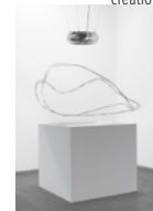
Zilvinas Kempinas, Flux, 2009, ventilateur, bande magnétique miniDV, socle en bois peint, 120 x 132 x 132, Paris, Centre Pompidou.