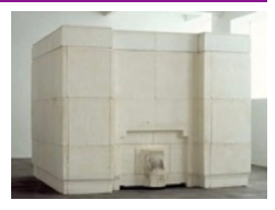
Rachel Whiteread, Ghost, 1990. Plâtre sur structure en acier, 269 x 355,5 x 317,5 cm. National Gallery of Art.