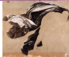
Anne Louis Girodet de Roussy Trioson, Etude de draperie pour "Scène de déluge", 1808, Mine de plomb et craie blanche sur papier beige, 48 x 56 cm, Musée d'arts de Nantes.