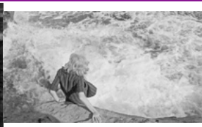
Michelangelo Antonioni, L'Avventura , 1959, 140 min