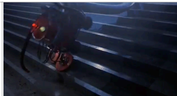
Terry Gilliam, Brazil , 1985, 142 min, science-fiction dystopique