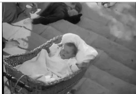
Sergueï Eisenstein, Le Cuirassé Potemkine , 1925

Vous expliquerez vos choix déterminants : Quoi ? Comment ? Pourquoi ? Penser à la question suivante : qu'est-ce qui fait qu'une scène appartient à un genre ?