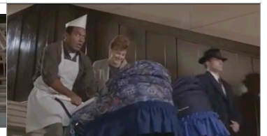
Peter Segal, Y a-t-il un flic pour sauver Hollywood ? (Naked Gun 33 1/3: The Final Insult) , 1994

Brian De Palma, Les Incorruptibles (The Untouchables) , 1987, 119 min, film policier, États-Unis — hommage sérieux à l'escalier d'Odessa : la scène reprend la poussette dans les escaliers en transformant le montage révolutionnaire d'Eisenstein en suspense policier spectaculaire.