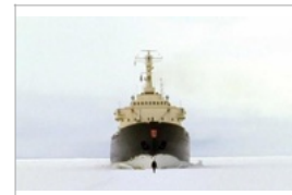
Guido van der Werve, Nummer acht - Everything is going to be alright , 2007, film en 16 mm.