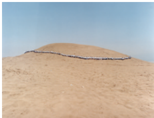
Francis Alÿs, When Faith Moves Mountains , 11 avril 2002. Action réalisée dans les faubourgs de Lima au Pérou.

LA MARCHÉ COMME ACTE CRITIQUE / POLITIQUE