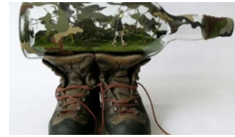
Laurent Tixador Chasse à l'homme , 2011. Bouteille en verre 4,5 L; matériaux divers + 1 video moyen metrage 65 x 55 x 40 cm. Pièce unique

LA MARCHÉ COMME GESTE POÉTIQUE, INTROSPECTIF OU EXISTENTIEL