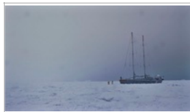
Pierre Huygue, A Journey that Wasn't , 2005. Installation audiovisuelle couleur, film super 16 mm et vidéo HD, 21 min 43s.