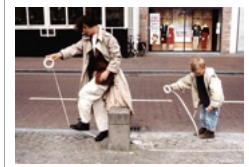
Esther Ferrer, Le chemin se fait en marchant , 2000-2015. Action protocolaire.

Empreinte : inscription du corps dans le lieu