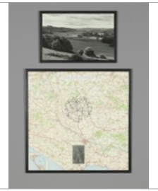
Richard Long, Cerne Abbas Walk , 1975. Encre, texte, photographie sur carte et photographie, 687 x 697 mm. Londres, Tate.