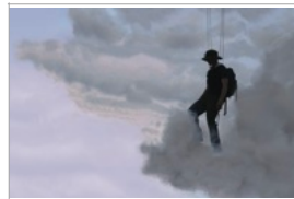
Abraham Poincheval, Marche sur les nuages , 2019, Vidéo numérique, couleur, son, 14'05"