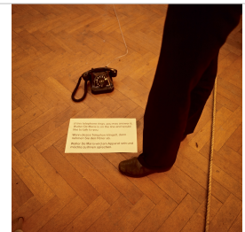
Walter De Maria, Art by Telephone , 1968.