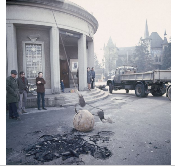
L'artiste Michael Heizer et l'exposant Harald Szeemann observent la commande de l'œuvre de Heizer, Bern Depression , devant la Kunsthalle de Berne en 1969.

A RETENIR ! L'exposition Quand les attitudes deviennent formes (1969) , organisée par Harald Szeemann, marque un tournant dans l'art contemporain en mettant en avant le processus de création plutôt que l'œuvre finie. Elle rassemble des artistes de l'art conceptuel, de l'arte povera et du land art, qui créent in situ, transformant l'espace en atelier vivant. Les œuvres sont souvent éphémères, sous forme d'actions ou d'interventions, remettant en question le modèle muséal traditionnel. Szeemann révolutionne ainsi le rôle du commissaire d'exposition, ouvrant la voie aux pratiques curatoriales expérimentales.