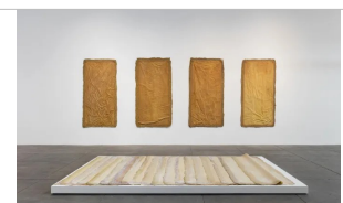
Eva Hesse, Aught , 1968. Double sheets of Rubber, plastic inside, each 78" x 40". Displayed at Kunsthalle-Bern.