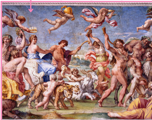
Le triomphe de Bacchus et d'Ariane, 1597-1607, 20 x 6 m, fresque, peinture