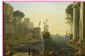
Lorrain Ulysse remet Chrysis à son père, 1644, 119x150 cm, huile sur toile