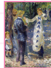
La balançoire, 1876, 130x170 cm, huile sur toile