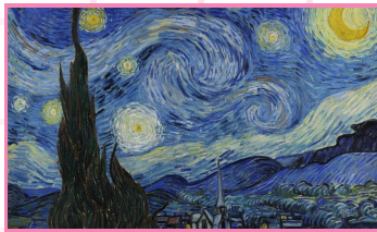
La nuit étoilée, 1889, 74x92 cm, huile sur toile