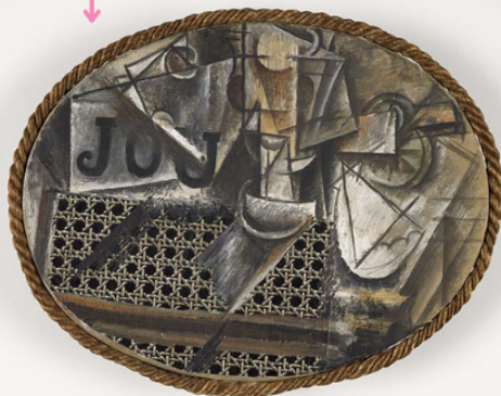
Nature morte à la chaise cannée, 1912, 29 x 37 cm, peinture et collage