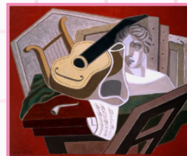
La Table du Musicien, 1914, huile sur toile, 92 x 73 cm