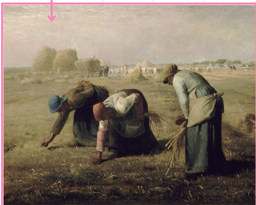
Des glaneuses , 1857, 83,5 x 111 cm, peinture à l'huile