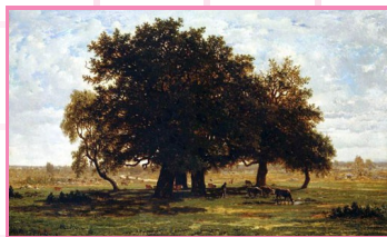
Groupe de chênes, Apremont, 64x100 cm, 1850-1852, huile sur toile