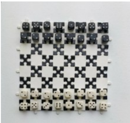
Alea jacta est Jérôme Pierre

Le format du puzzle est de 20*30 centimètres. La réalisation symbolise la perte partielle d'un souvenir d'enfance. Le puzzle est censé être suspendu au plafond, comme le montre la photographie : cela a deux effets. L'image est vue de travers, puisque le fil n'est pas centré, et elle tourne légèrement, donnant au spectateur de multiples points de vue sur le puzzle. Celui-ci rappelle l'enfance, comme le pastel gras, là où les pièces manquantes et l'adhésif visible au dos évoquent un souvenir heureux, mais en train de se perdre. Cette production peut faire penser à l'art naïf, un courant artistique s'inspirant de dessins d'enfant, brisant donc les codes de l'art comme on le voit.