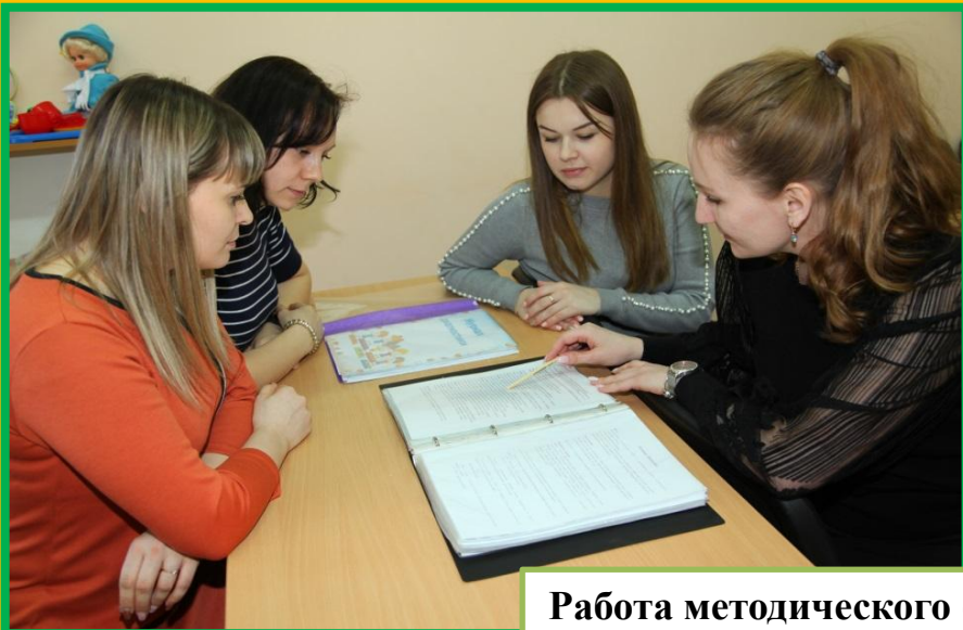
Работа методического объединения педагогов по вопросам психолого-педагогического сопровождения детей с ОВЗ