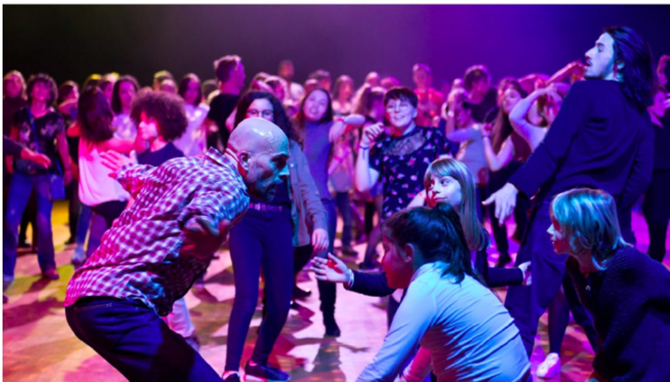
Le Bal Chorégraphique

Une chorégraphie contagieuse envahit la foule, créant un happening festif !